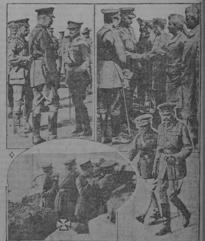
Ultimas "poses" de Lord Kitchener, quien ha formado en poco tiempo una sólida preparación militar en Inglaterra. Kitchener, que estuvo en todos los "frentes" y en Salónica, Suez, murió en el hundimiento del Hampshire.

do la historia le han precedido en el curso del tiempo. Expuesto así el fuerte encadenamiento de los fenómenos que ofrece la vida colectiva, es claro que para determinar con rigor científico los antecedentes de un gran acontecimiento político, sería necesario reconstituir la historia entera del planeta hasta antes de la nebulosa. Y dicho se queda que no estando la empresa al alcance del hombre, re (Pasa a la página DOS)