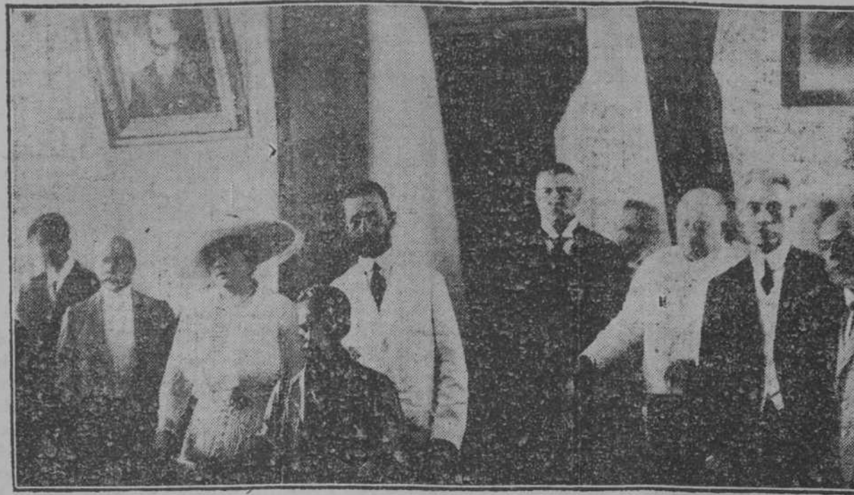
LA INAUGURACION DEL PREVENTORIO MARTI.—EL SR. PRESIDENTE DE LA REPUBLICA Y SU DISTINGUIDA ESCUPELA...