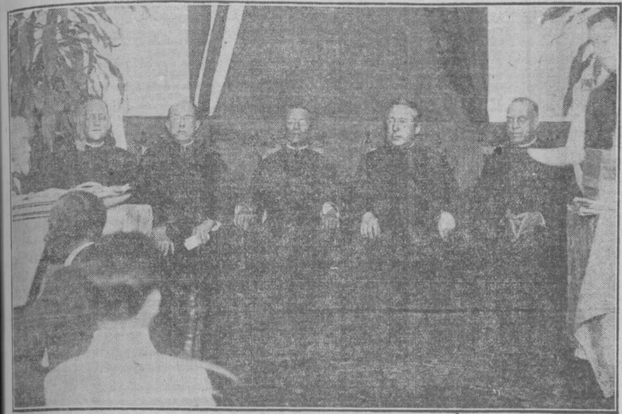
Escuelas Pias de la Habana.—Distribucion de premios.—La presidencia del solemne acto.

Con el brillante acto efectuado ayer tarde, la solemne repartición de premios, terminó el curso en el Colegio que los PP. Escolapios tienen establecido en la calle de San Rafael. Los profesores de la Comunidad, los alumnos, y los padres de éstos, asistieron unas horas, que parecieron largos, saboreando el triunfo: los primeros, de sus desvelos en pro de la educación de los jóvenes discípulos; los segundos, de sus estudios y trabajos para aprender; los últimos, de los sacrificios que realizan para dar a la familia y a la sociedad hombres útiles. A las tres de la tarde a los padres de familia se les dio un informe por el quinteto que dirige el maestro Reinoso, empezó el acto ocupando la presidencia el Muy Rvdo. P. José Colonge Vivario Provincial de las Escuelas Pias; el Muy Rvdo. P. Antonio Orazá, Rector del Colegio de Belén; y el P. Macías, de este Colegio; el Rvdo. P. Lorente, Rector de las Escuelas Pias del Cerro; el P. Cirés, de la Comunidad de Guanabacoa y el P. Agustín Pagés; el P. Folch, párroco del templo de La (PASA A LA SIETE)