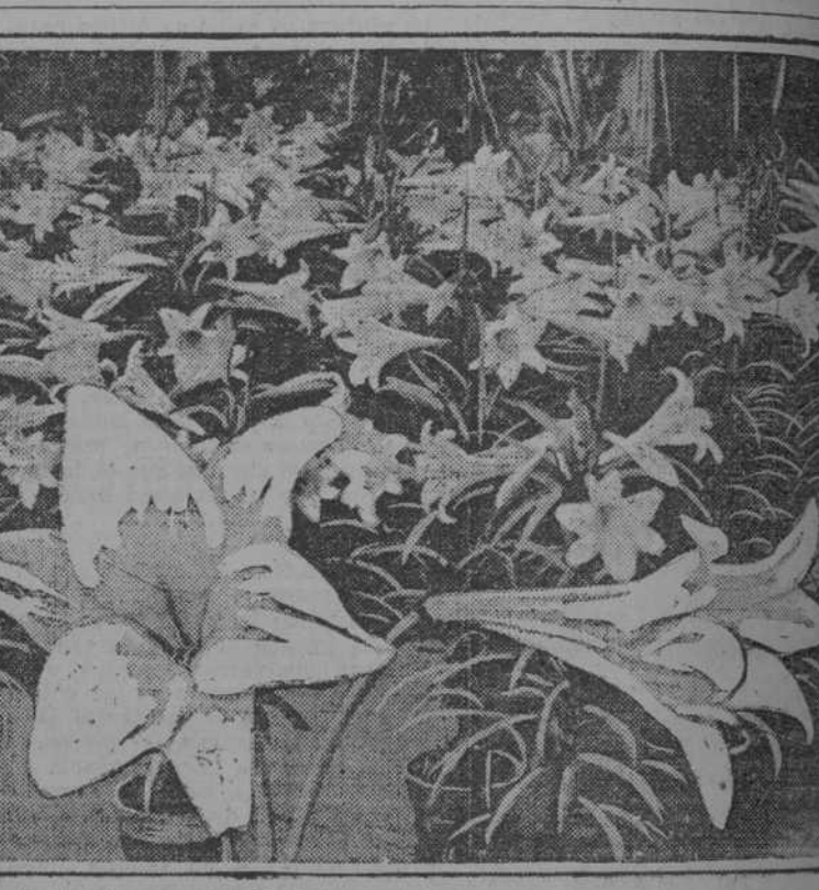
LA PRIMAVERA.—Campos de tilas, en las llanuras del Este.