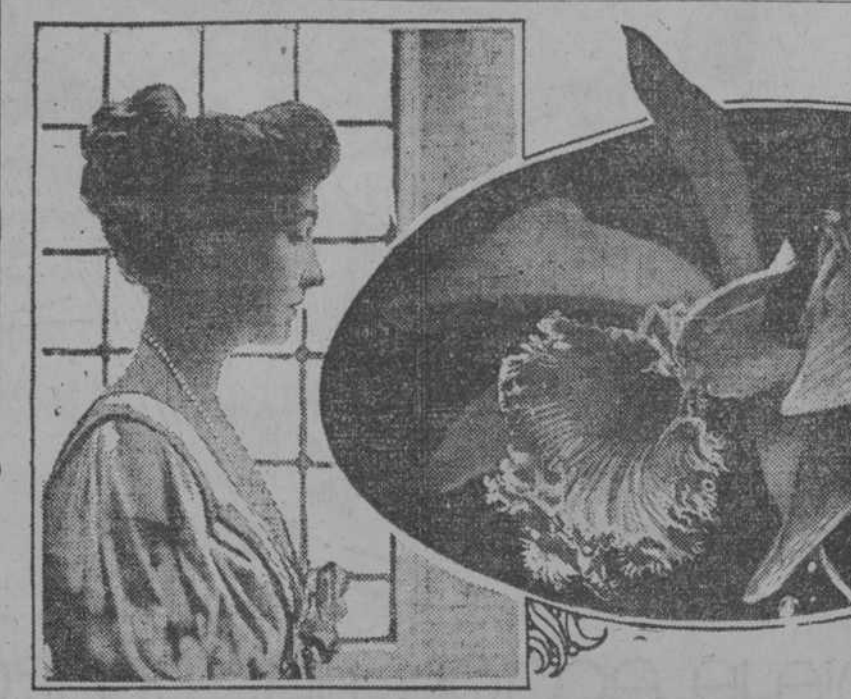
ORQUIDEAS DE PRINCESA. — Princesa Patricia, hija del Duque de Connaught, ha dado su nombre a un género de orquídeas. Una de éstas se ha vendido en $1,000 para la Cruz Roja inglesa.