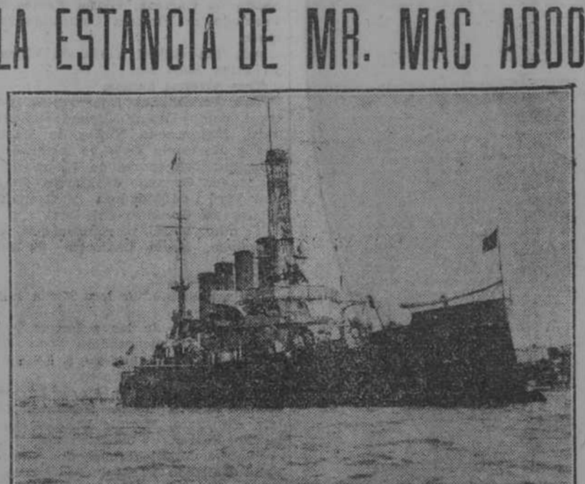
El crucero acorazado "Tennessee", que llegó ayer a la Habana conduciendo a la Alta Comisión financiera que preside mister Mc. Adoo.

Un areograma del "Infanta Isabel" a 2.000 millas de la Habana. Los señores Santamaria, Suarez y Co., consignatarios de los vapores de "Infanta", nos participan haber recibido en el día de ayer, un areograma del vapor "Infanta Isabel", a dos mil millas de distancia de este puerto, participándonos que todos los pasajeros continúan en perfecto estado de salud y que envían saludos cariñosos a sus familiares y amigos.