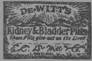
La caja mágica azul y oro