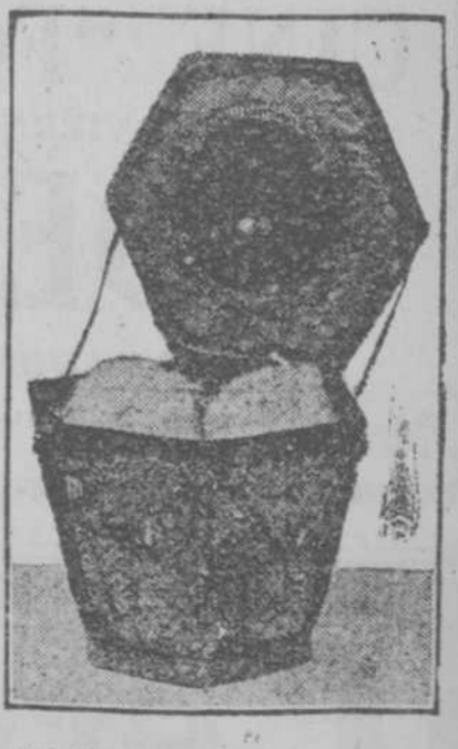
POLVERA, simulando un nido de dos huevos, de plata y oro. ¡Una verdadera preciosidad!

Al decir esto extendió el brazo, y en cuanto hubo caído un copo de nieve en la manga de su americana negra lo cubrió con la mano. —¡Mirad pronto!—dijo mostrando el copo de nieve a los niños. Centellea como un diamante, se parece a una estrella de seis puntas y no es blanco, ni sólido. La nieve parece blanca pero tiene realmente el color del hielo y es hielo. Parece blanca porque forma una densa masa y con sus infinitas puntas como agujas despareja a luz en todas direcciones. Cuando oprimis una bola de nieve chafáis esas delicadas agujas, pero no destruis las finas partículas de los pequeños diamantes o cristales de la nieve. La nieve que tan bonito aspecto da a la tierra no es sino agua helada, y esto nos demuestra los cambios extraordinarios que pueden sufrir una misma cosa: granizo, escarcha, rocío niebla, hielo lluvia nieve... Vosotros mismos si os lo