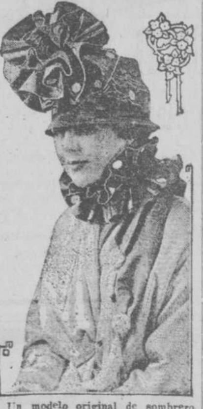
Un modelo original de sombrero, que está hecho, en paja azul marino y su lazada de satén.

Lo mismo que en tiempo que ya pasó, en otra época, en tiempo de entonces, derivado del adverbio árabe "marrat" que significa lo que pasó: viene a ser el "Olim" en otro tiempo, de los latinos. Es muy antiguo en castellano este modismo, como que se lee ya en la vida de San Millán por Gonzalo de Berceo.