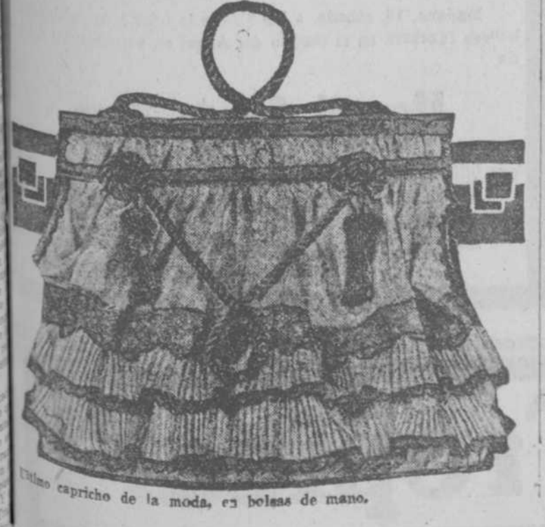
Este capricho de la moda, es bolsa de mano.