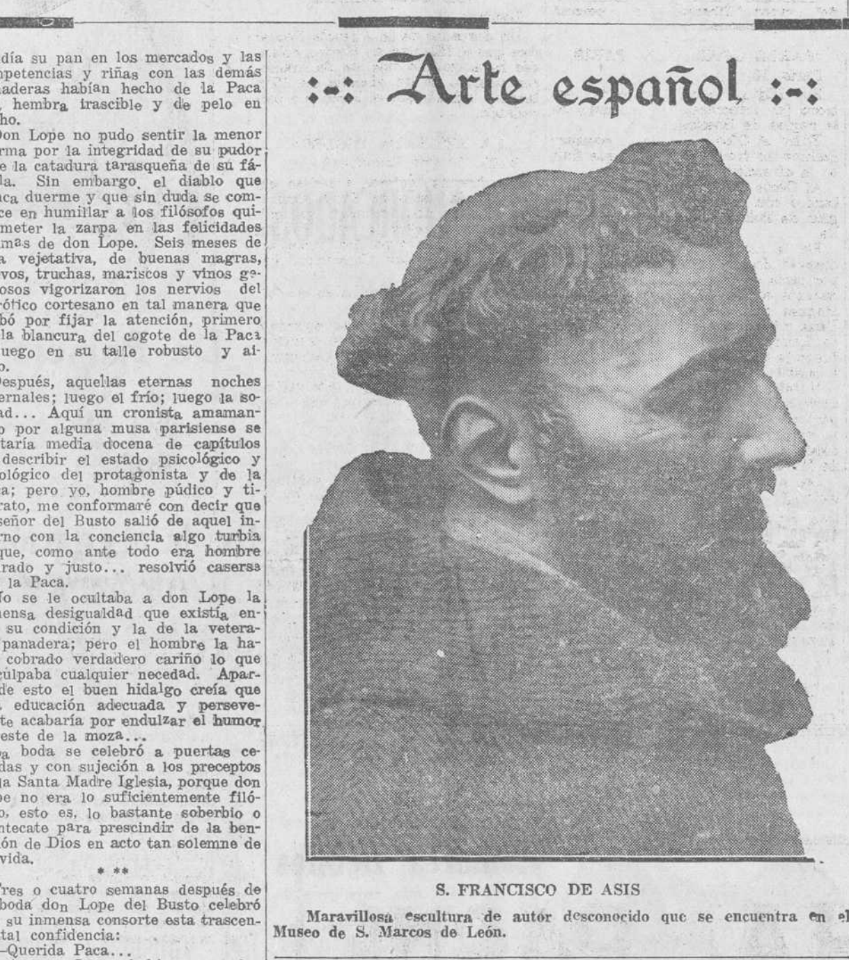
Maravillosa escultura de autor desconocido que se encuentra en el Museo de S. Marcos de León.