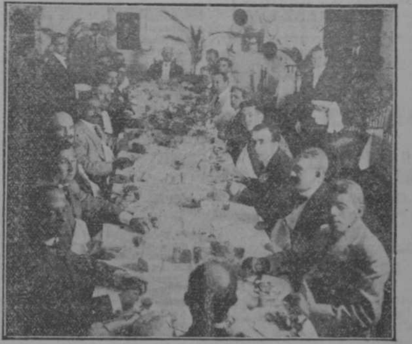
Banquete ofrecido por los señores Canto y Ca. a las autoridades y prensa, con motivo de la reapertura de su establecimiento de Novedades, titulado "La Francia," banquete celebrado en el Hotel "Imperial" de los señores Pérez Hnos.

hizo parpadear a los madrileños al estilo del arcipreste! Porque tengan ustedes en cuenta que este señor era de "brava complexión" y largaba pedradas "arrebujado en su manto de oscarlata". Y con algunos disparates más me retiro por ahora, deseando a mis lectores que no vayan a tropezar con este arcipreste semi-ortodoxo. Angel María SEGOVIA