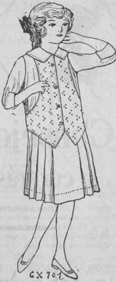
De crepé bordado, $1.75

Creas, Warandos y Madapolanes a precios de fábrica