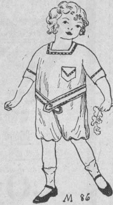
De warandol, 30 centavos

Tiras bordadas y encajes casi regalados.