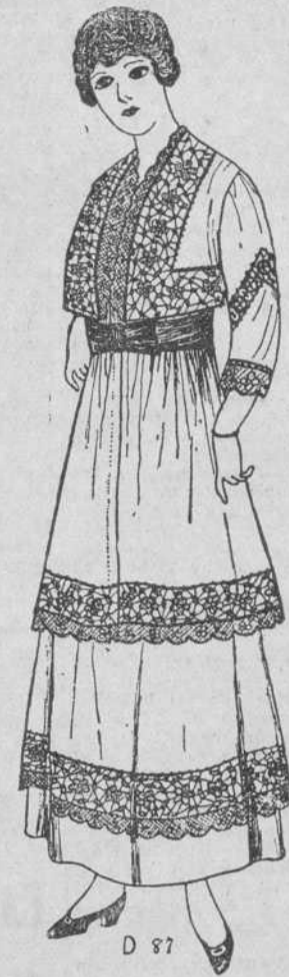
De crepé superior, $4.95

de rebaja en telas de fantasía, sedas y Corsés.