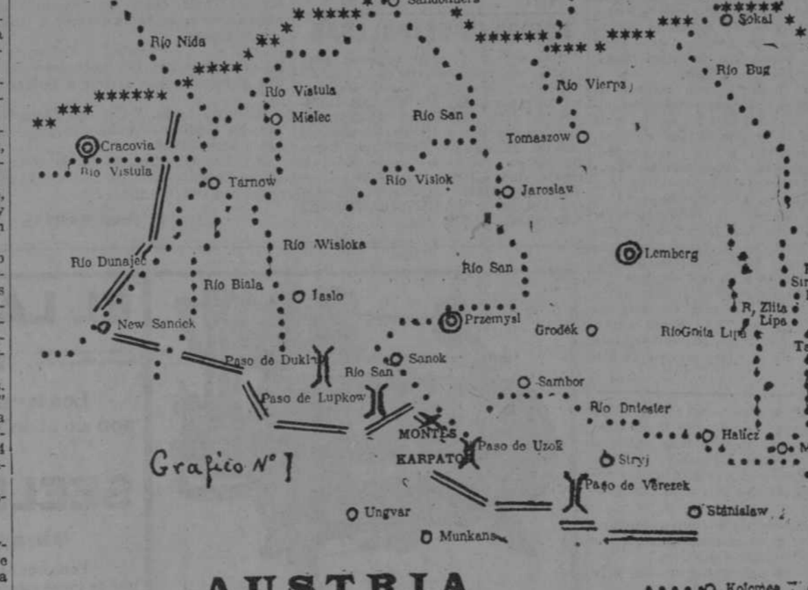
Las estrellas negras representan la frontera de Austria y de Rusia.—La línea de puntos negros son ríos.—Las estrellas blancas con doble círculo son plazas fuertes.—Los círculos en blanco son plazas abiertas. Cada centímetro en el croquis representa aproximadamente veinte kilómetros en el terreno.

SANDEK, DESPRENDIENDOSE DESDE EL DUNAJE, PARA OPERAR ENTRE ESTE RIO Y EL BIALA SITUANDOSE EN MALASTOW.