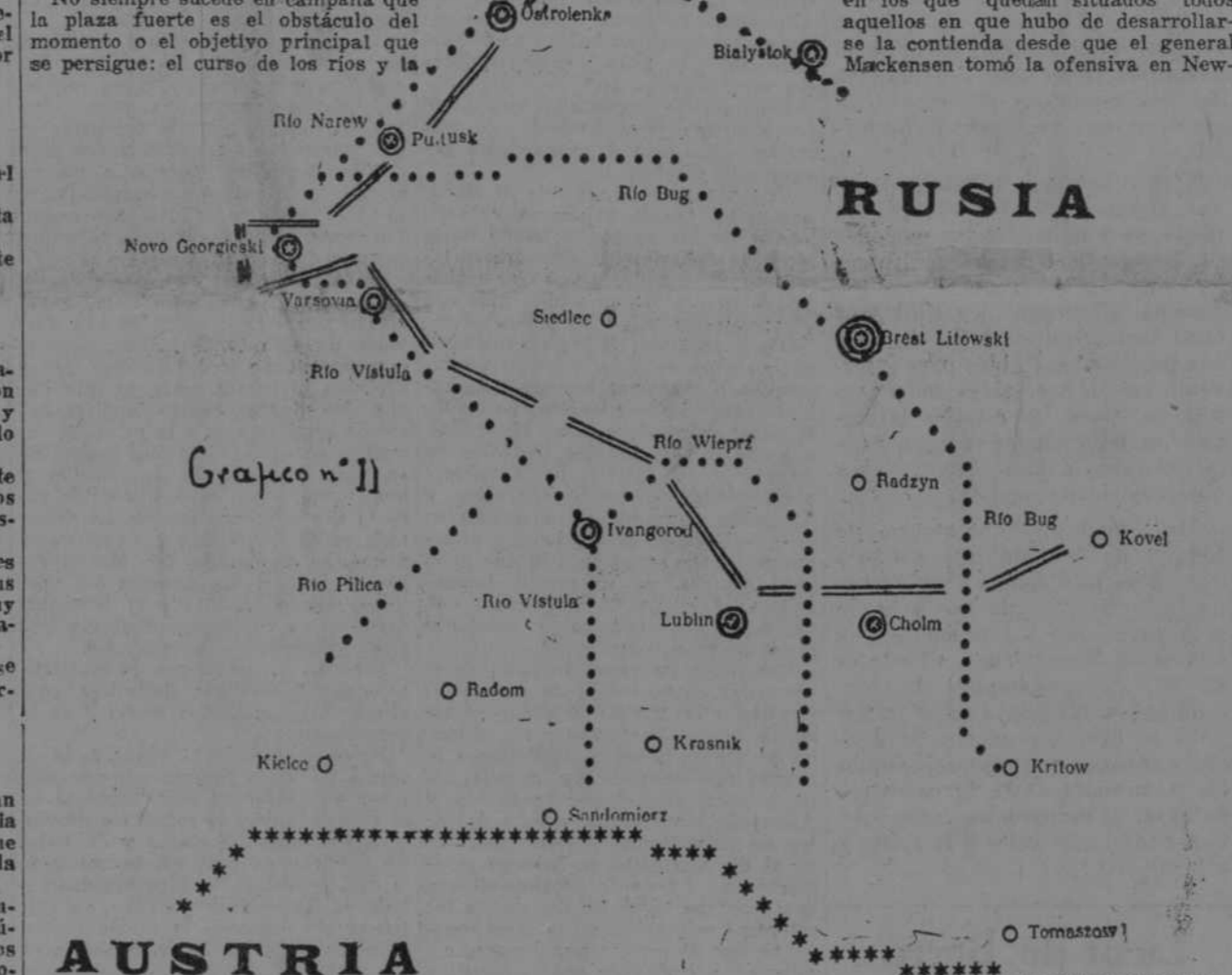
Las estrellas negras representan la frontera de Austria y de Rusia.—La línea de puntos negros son ríos.—Las estrellas blancas con doble círculo son plazas fuertes.—Los círculos en blanco son plazas abiertas. Cada centímetro en el croquis representa aproximadamente veinte kilómetros en el terreno.

No siempre sucede en campaña que la plaza fuerte es el obstáculo del momento o el objetivo principal que se persigue: el curso de los ríos y la