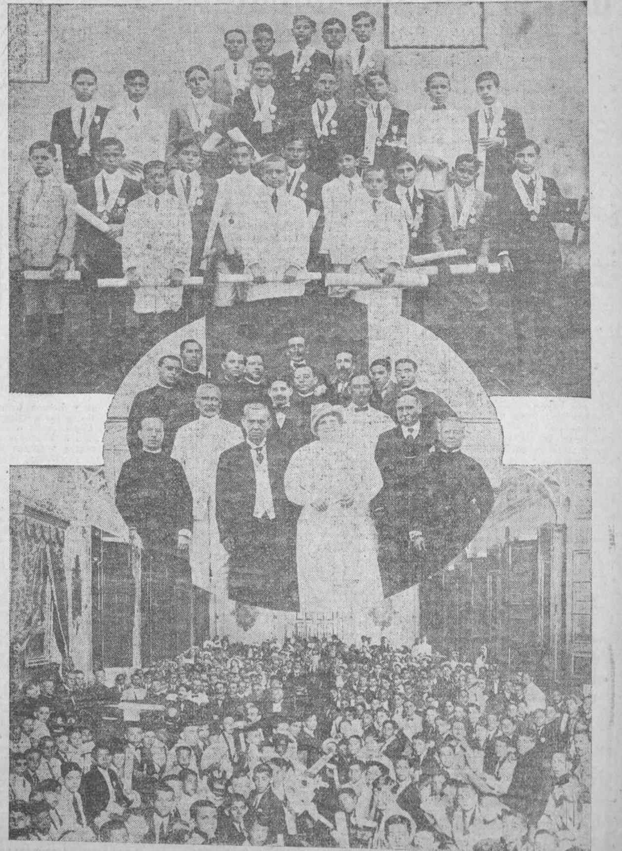
En la parte superior. Grupo de alumnos que obtuvieron primer premio.