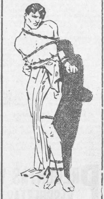
Así está el Reumático.

ASI lo mantiene el dolor agudísimo de sus músculos, el retorcimiento de sus huesos, la angustia tremenda que lo inmobiliza, porque cada movimiento es un tormento. PERO EL REUMATICO romperá sus cadenas, se liberará de ellas, haciéndolas saltar en pedazos y quedará libre, ágil, sano y sin dolores ni sufrimientos, si toma el Antirreumático del doctor Russell Hurst de Filadelfia, que alivia el reuma en cuanto se empieza a tomar y lo cura en breve tiempo, radicalmente.