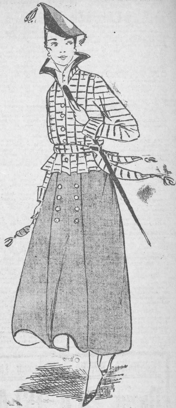
TRAJE DE CALLE; UNA TOILETTE TAN ELEGANTE COMO ORIGINAL.

Pues sí; sería grato, agradable, ameno, instructivo, eso de que las tres ilustres se dignaran obsequiarnos (buen regalo!), con su parecer. Pero siempre, ya se sabe, comparando las modas y costumbres de aquellas tres épocas con las de hoy. Si los zapatos ostentosos, llamativos, de altísimo tacón e historida hebilla; las medias disimulando desagradable desnudez; expuesta a no ser pulsera, por causa del polvo de las calles; las faldas estrechas al terminar, cortas, no a beneficio del doñante, sino del desgaire, para que conste bien lo mal que pisan y andan innumerables mujeres; faldas anchas al empezar; y de este modo, con esta moda, podrán ufanarse de su esbeltez las descaderadas... Los corpiños anchos, tan holgados, que más parecen prestados que propios; los descotes a la orden del día en pleno invierno y plena intemperie, pidiendo a reventar pulmón una pulmonía; alto de talle, hundido el sombrero, liso el peinado, sueltas las mangas, numerosas y bulliciosas las pulseras en forma de aros; amplio el abrigo, que no debe parecer abrochado; resuelto el andar, suelto el ademán; en el picarresco sombrero el alfiler de corbata de algún galán; en el bolsillo, y para las tarjetas o el dinero, la petaca, ya usada, como el alfiler del jovencuelo preferido; en la ima-