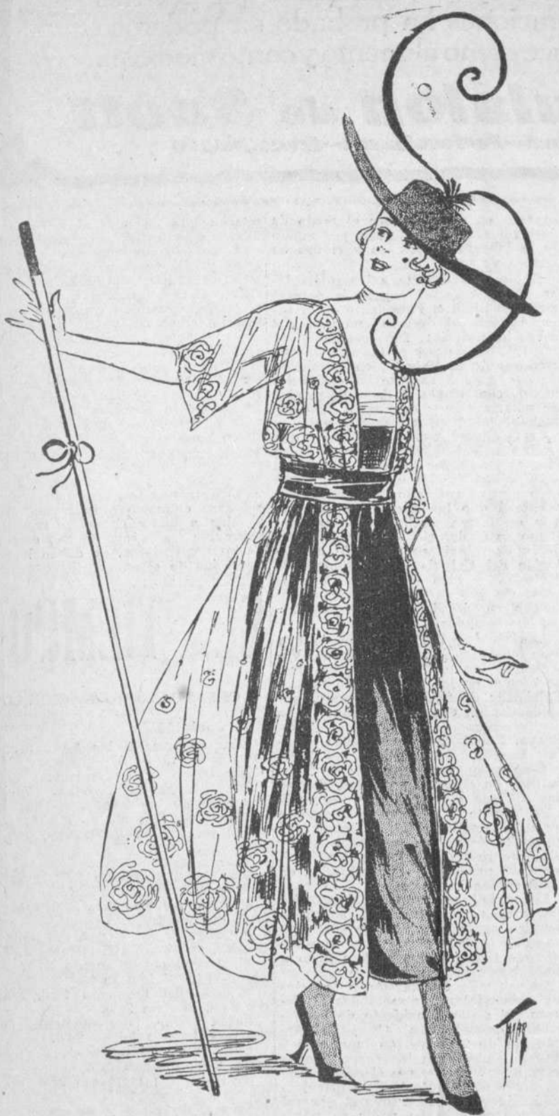
TRAJE DE TANGO. CREACION ELEGANTISIMA DE LA MAISSON JEANNE.

Para "El Diario de la Marina" 1653-1731-1860-1915