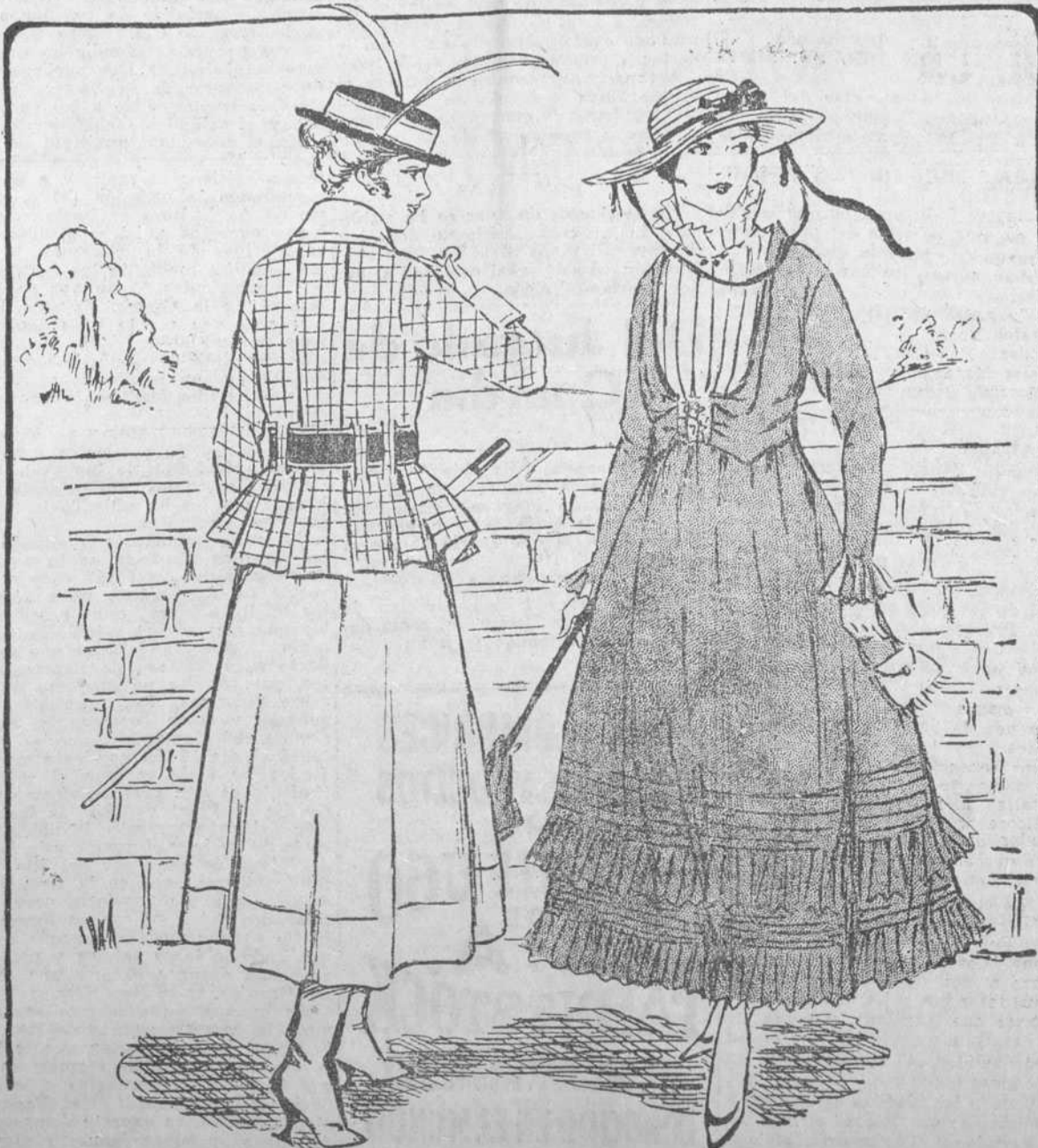
DOS SOMBREROS DE VERANO ULTIMO Y DOS TRAJES QUE SON TAMBIEN LA ULTIMA EXPRESION DE LA MODA.