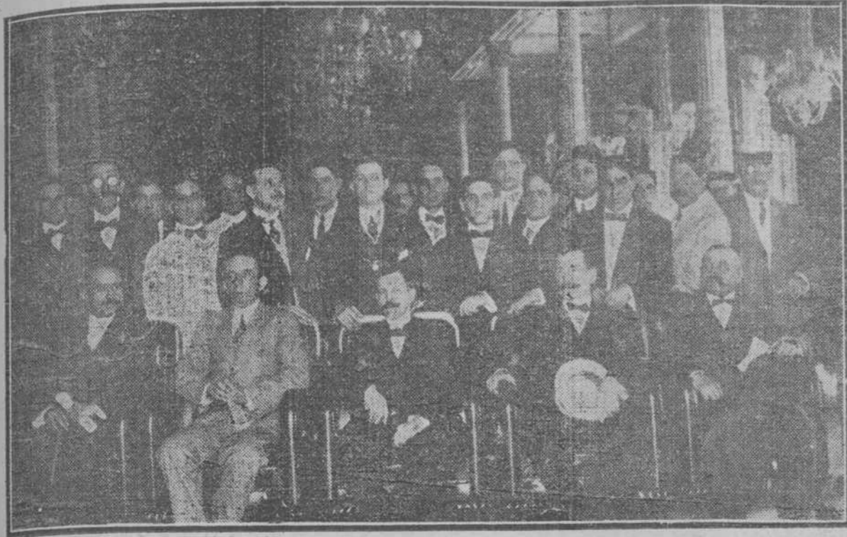
EL NUEVO DIRECTORIO DE LA ASOCIACION DE REPORTERS QUE AYER TOMO POSESION, Y ALGUNOS CONCURRENTES AL ACTO.