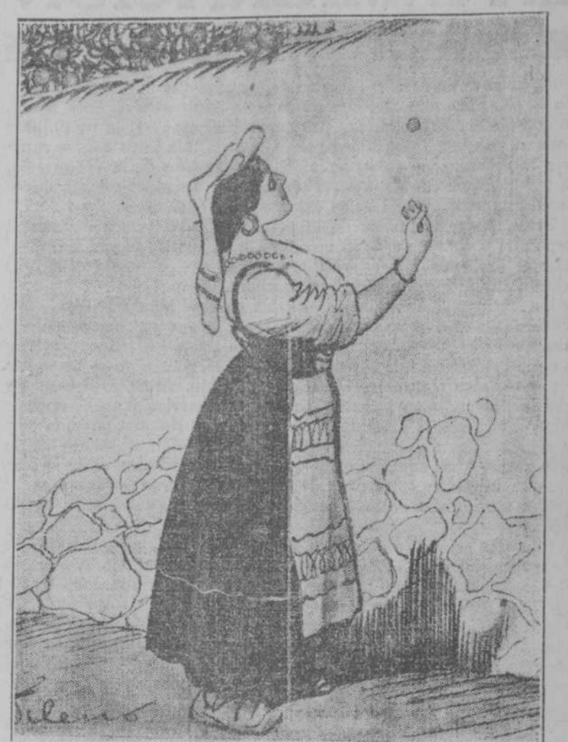
—¡Contra quienes intervengo! Lo echaré a cara o cruz. (Gedeón, de Madrid.)