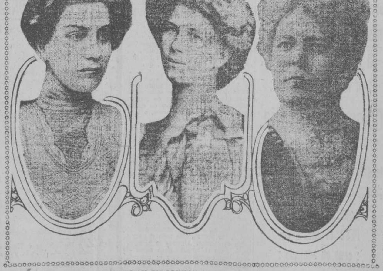
TRES PROMINENTES SEÑORAS DAN SU OPINION SOBRE EL SUFRAGISMO.—Tres de las principales sufragistas americanas al entrevistarse con el gobernador del estado le explicaron que la única manera de poner fin a la trata de blancas, sería edificando a los jóvenes delincuentes, pudiendo ser enviadas y donde se les enseñara la moralidad. Si las mujeres obtuvieran el voto o sufragio inmediatamente legislarían sobre este punto enseñando a sus hermanas el camino recto.

Una Comisión de estudiantes estuvo hoy en el Ayuntamiento con objeto de recabar de los Concejales que voten un crédito de 200 pesos para sufragar los gastos que origine la serie de decisión en esta capital del champion infantil que están organizando en toda la isla.