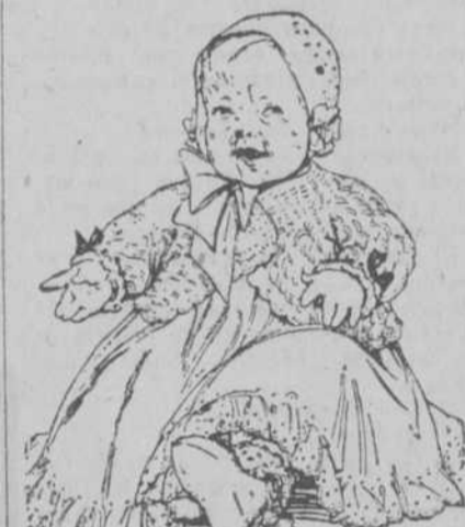
Esta infeliz criatura es víctima de su atavio. Está molesto porque se consume de calor. Así no debe vestirse en los días cálidos. No vistas tu Baby para lucirlo. Vístelo para tenerlo contento y saludable.

car al niño en lecho aparte del de la madre... Cada uno en su cama. Hon.—Por mucho que se insista sobre eso, no será todavía lo suficiente. La nueva madre está ciega y quiere tener al pollito bajo el ala... Ang.—Pero, señor, ¿cuándo la dejarán a una hablar? Así vemos casi diariamente, ¿sabe? en los periódicos noticias de recién nacidos que mueren asfixiados, ahogados por la opresión... Trig.—¡Jesús, qué horror! ¿Pobre niño! Dios me libre de eso al niño... Ang.—No me interrumpas ¿comprende?... Por la opresión que inconscientemente produce la madre dormida sobre el hijo, cuando lo tiene en su misma cama, y por este motivo ¿sabe? es conveniente machacar y machacar para que no se reptan las fatales consecuencias de práctica tan peligrosa... Encontrar un cádaver!