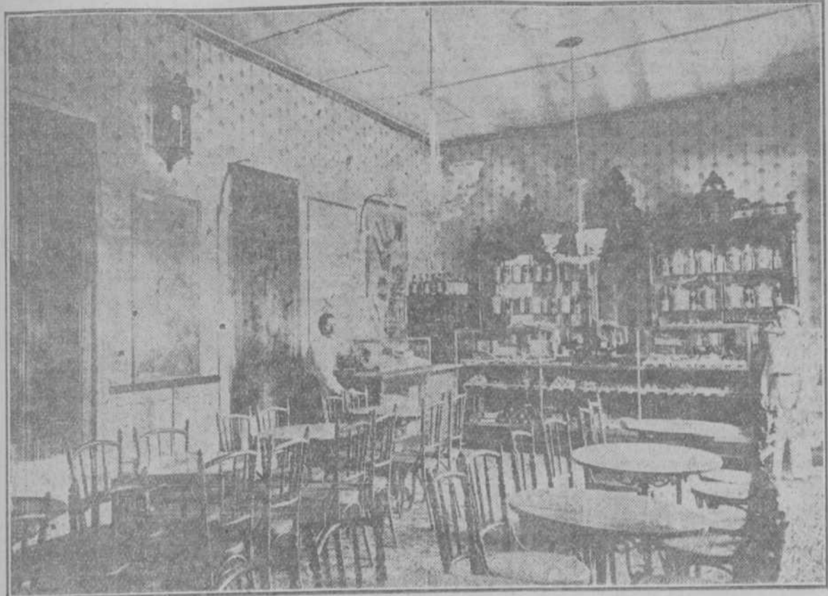
REMEDIOS.—Interior del café y dulcería del señor Luis Más, uno de los más populares de aquella importante villa.