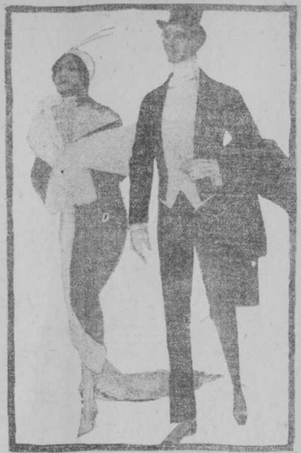
Temporada de Opera.