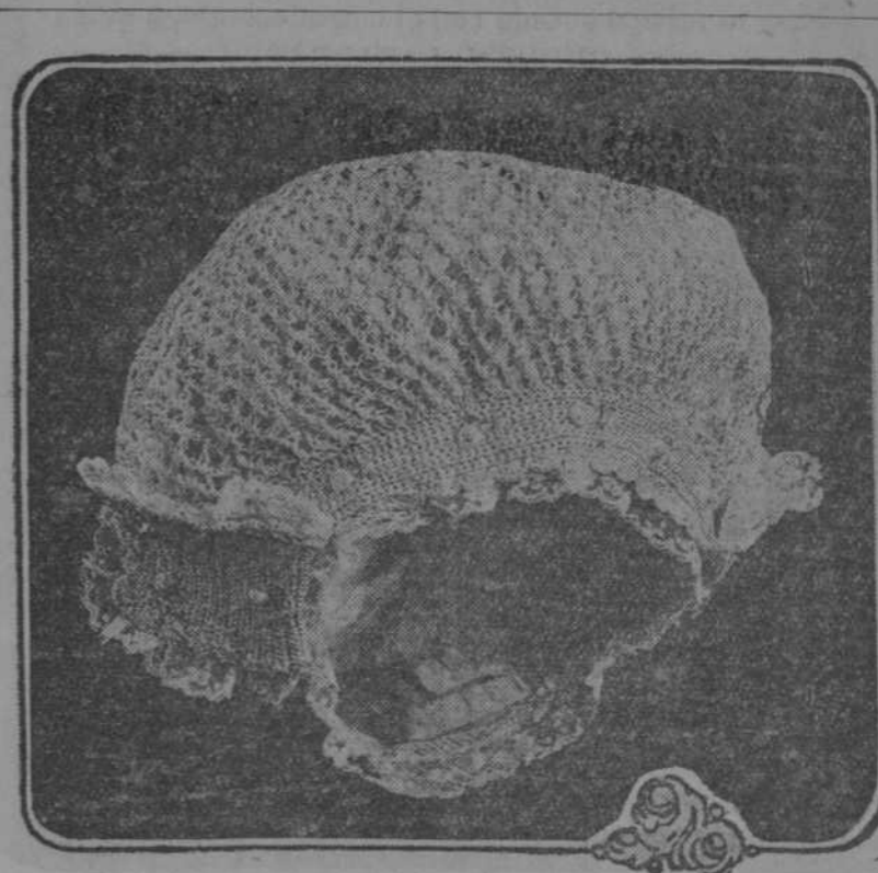
Elegante gorro de dormir; trenzado con encajes e hilo de Oro.