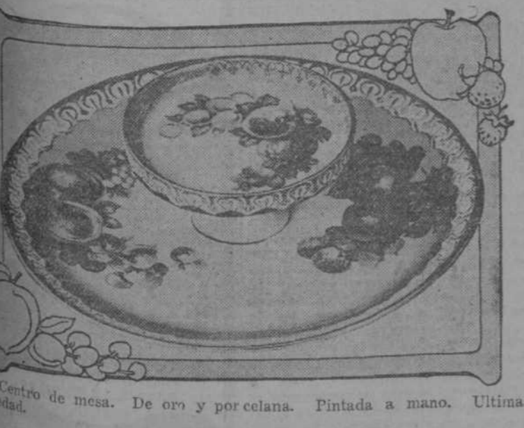
Centro de mesa. De oro y porcelana. Pintada a mano. Última novedad.

ideada por un almacénista de confecciones que se adelanta hacia las señoras alegres y haciéndoles una rendida reverencia, las dice: ¿Queréis ser bonitas y amadas? Pues no hay que apurarse, se os complacerá en seguida; no tenéis más que comprar mis corsets Sirena, mi medias caladas a 895, mis pantalones con encajes... la belleza y la elegancia al alcance de todas las fortunas.