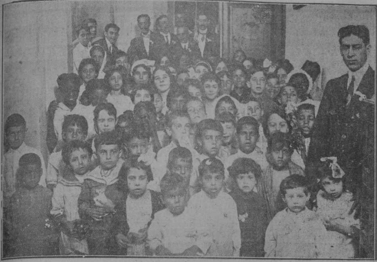
LOS ASISTENTES A LA FIESTA DE SAN NICOLAS.