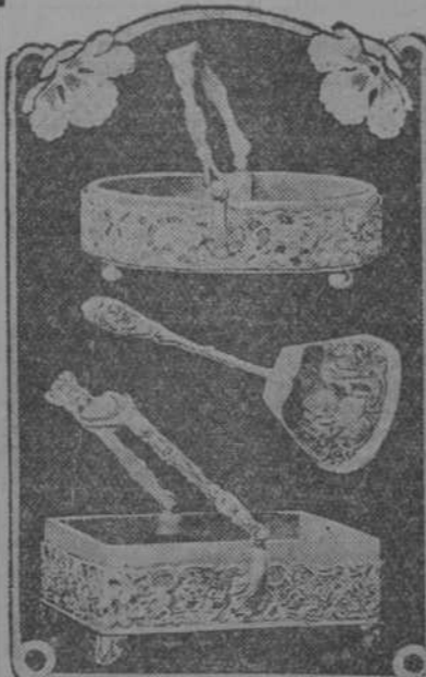
Bomboneras de cristal y plata; y pala de plata; modelos de reciente creación.