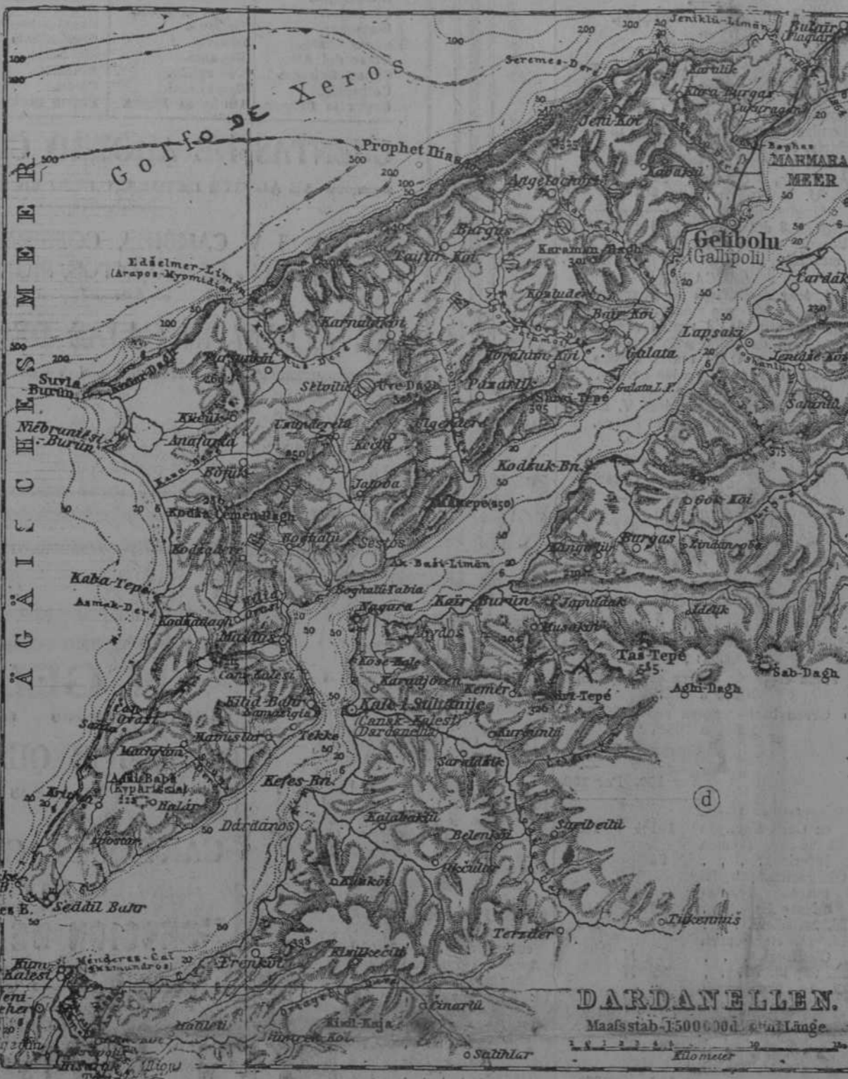
Plano del Estrecho de los Dardanelos.

OFRECEMOS A NUESTROS LECTORES UN GRAFICO DE ESTA PARTE DEL TEATRO DE LAS OPERACIONES PARA QUE SE PUEDA DAR CUENTA DE LAS DIFICULTADES QUE SE PONE EL PASO DE DICHO ESTRECHO Y LA TRAYESIA DEL MAR DE MARMARA, CASI CUATRO VECES MAYOR QUE LA LONGITUD DE LOS DARDANELOS.