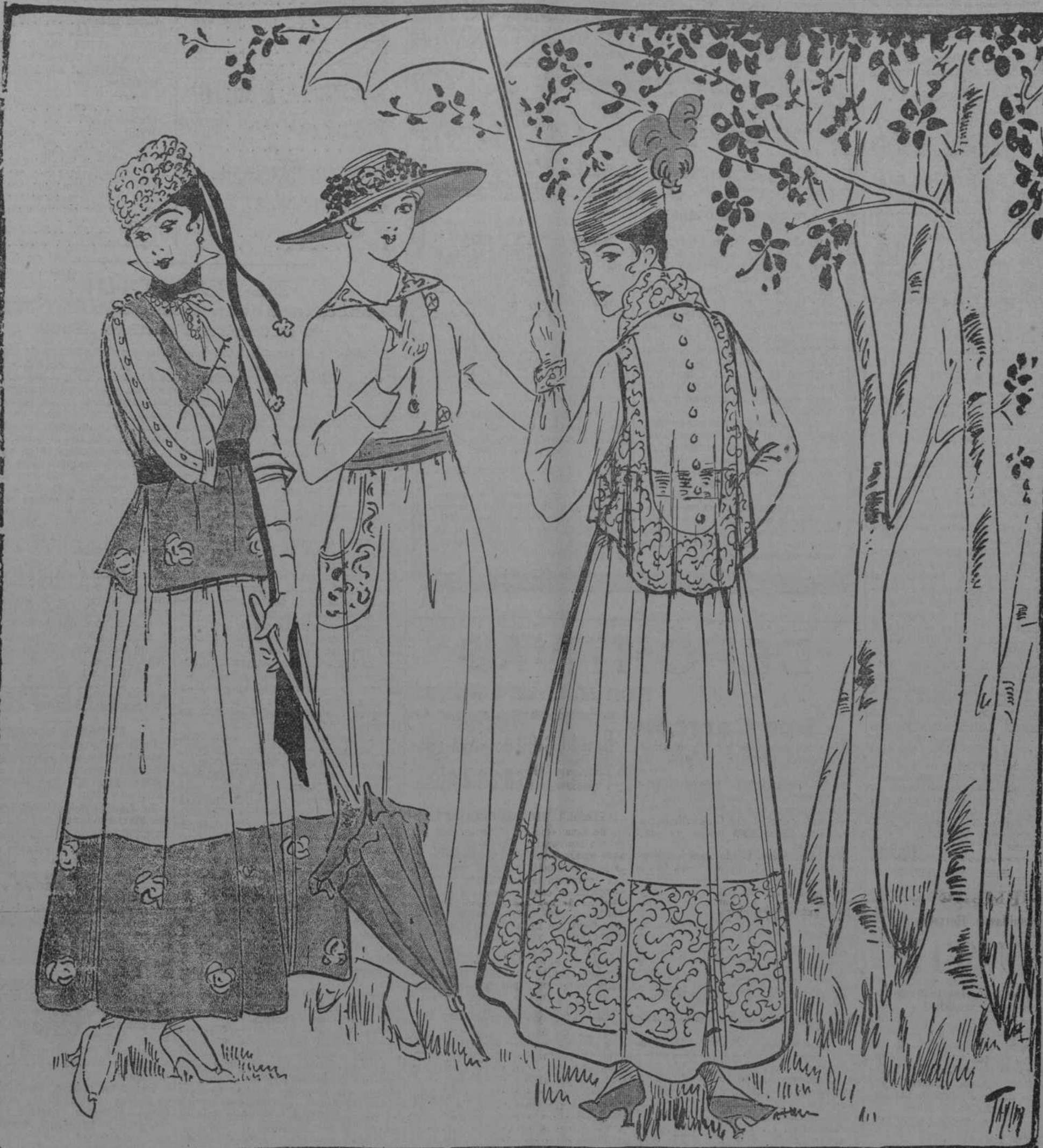
(DE IZQUIERDA A DERECHA).—TRAJE DE HILO, COLOR BLANCO; CON SOBRE-BLUSA Y VUELO DE FALDA DE COLOR GRIS; BANDA DE TERCIOPELO NEGRO...