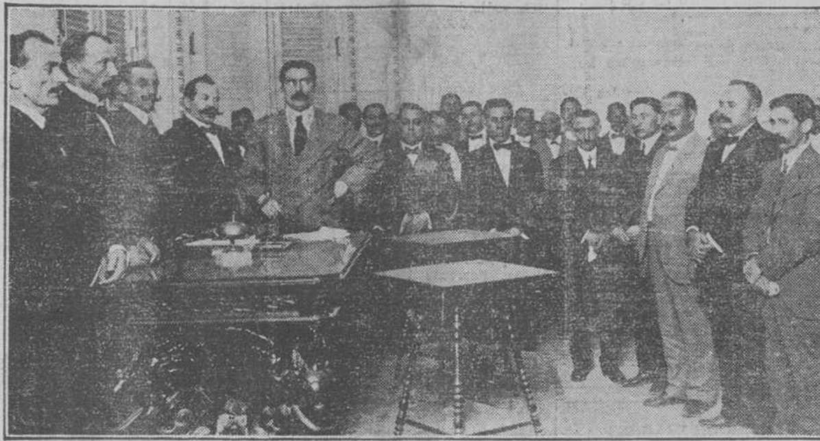
LA DIRECTIVA DEL CENTRO GALLEGO TRATANDO EN SESION SOLEMNE DE LA MUERTE DE SU PRESIDENTE

MILLARES DE PERSONAS VISITAN LA CAPILLA ARDIENTE.