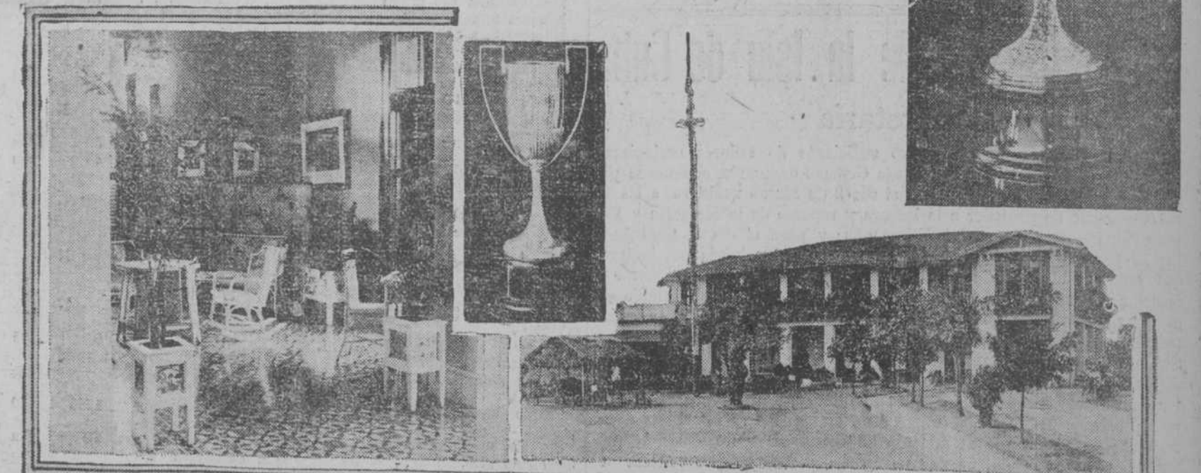
"LADIES-ROOM". — COPA PARA EL VENCEDOR DEL "ANNUAL TOURNAMENT". — "THE COUNTRY CLUB OF HAVANA". — OTRA COPA DEL TORNEO

En la travesía se salvó de milagro, pues el "Sloterdijk" fué registrado por marinos ingleses que detuvieron el barco en alta mar, sin que encontrasen al desertor alemán, pues éste estaba aún oculto en su escondite del buque.