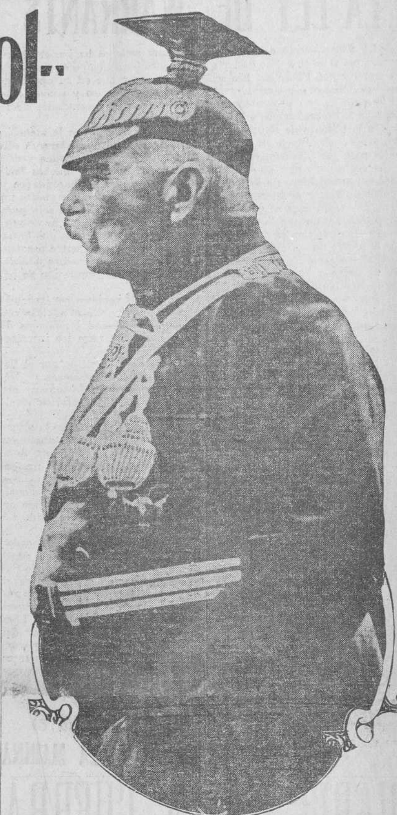
El Conde de Zeppelin en quien está fija la atención mundial, con motivo de su anunciada invasión aérea en Inglaterra.

Madrid, 27. Los organizadores del homenaje al señor Dato trabajan activamente para que la fiesta resulte brillante. Las adhesiones recibidas hasta ahora son muchas.