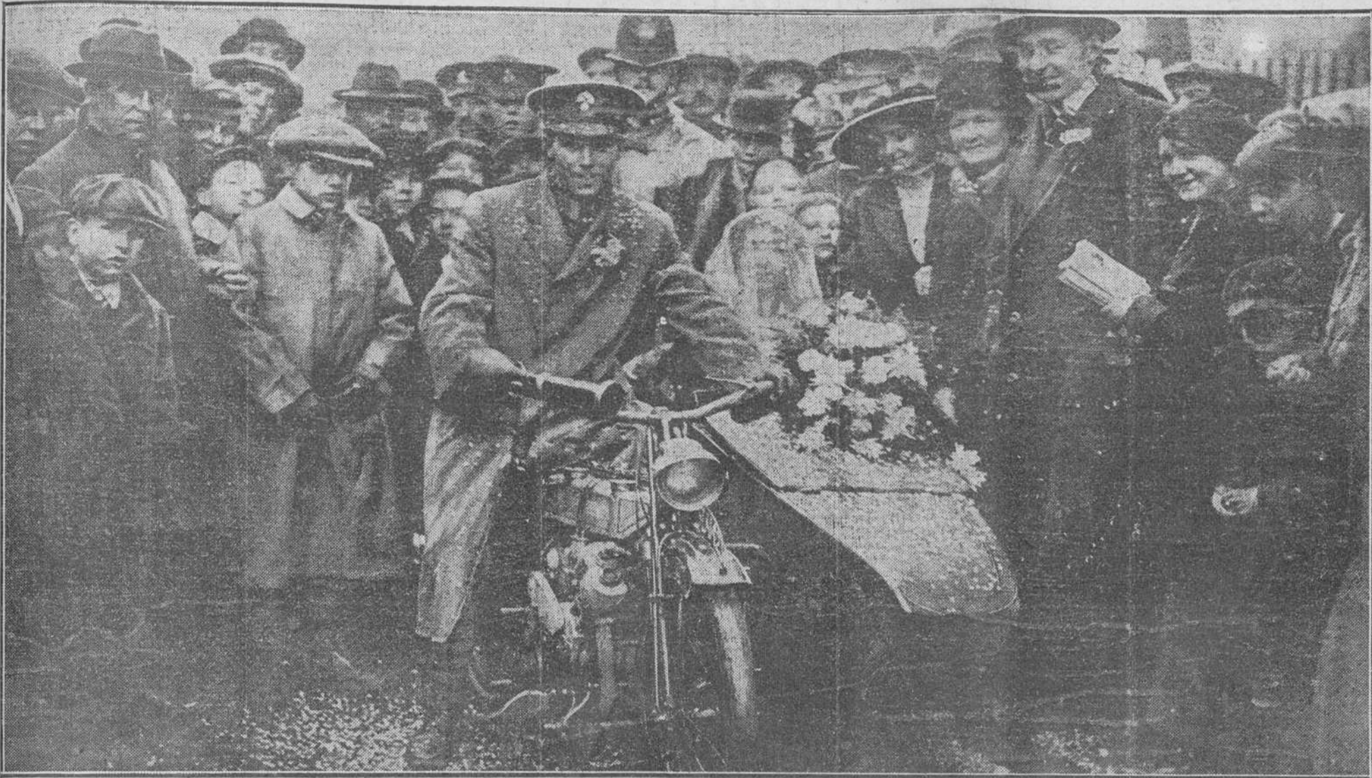
Boda de un soldado inglés en Londres. — Sale con su novia en motocicleta a disfrutar de breve luna de miel, eliminándose todo convencionalismo por las exigencias de la actual situación.