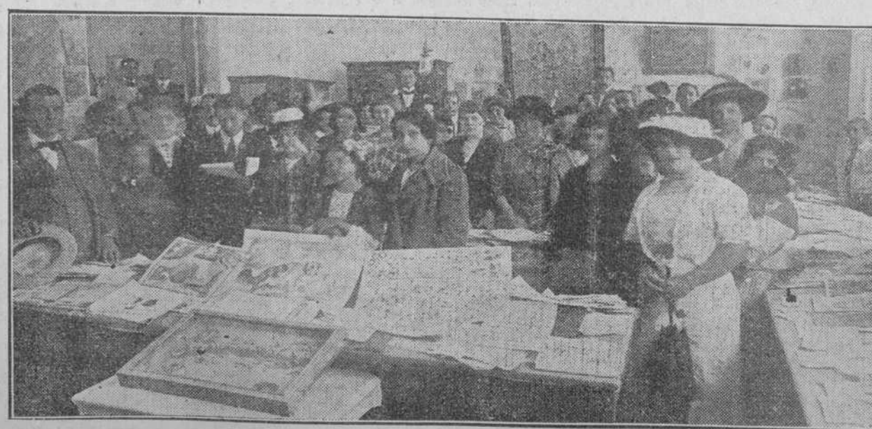
Un aspecto de la Exposición de las Escuelas públicas de Matanzas.

Fracaso de la conferencia socialista en Copenhague.