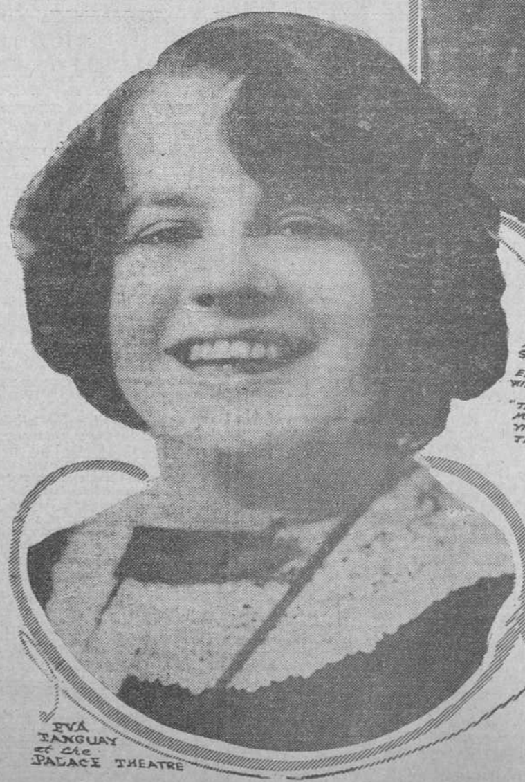
EVA TANGUAY et Cía PALACE THEATRE