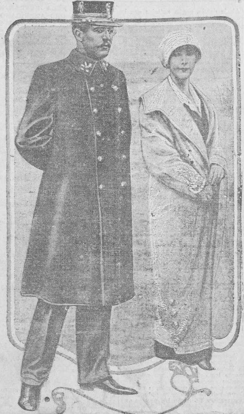
LOS REYES SIN REINO.—El rey Alberto de Bélgica y su esposa, la reina Isabel. Esta fotografía fue tomada recientemente en el cuartel general de una de las divisiones del ejército aliado, a poca distancia de la línea de batalla.