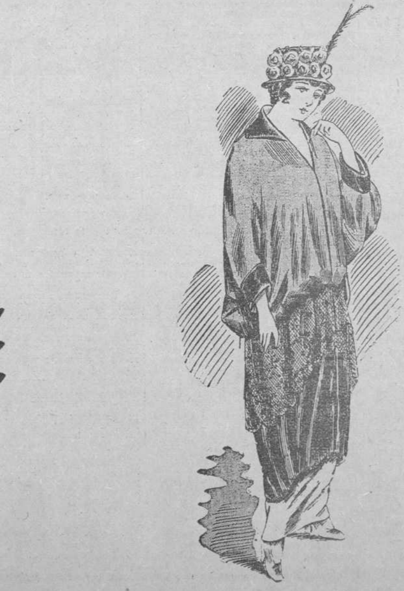
CLORIS Confección de seda brochada, todos colores, vuelo de Chantilly negro, forrado seda, artículo nuevo.