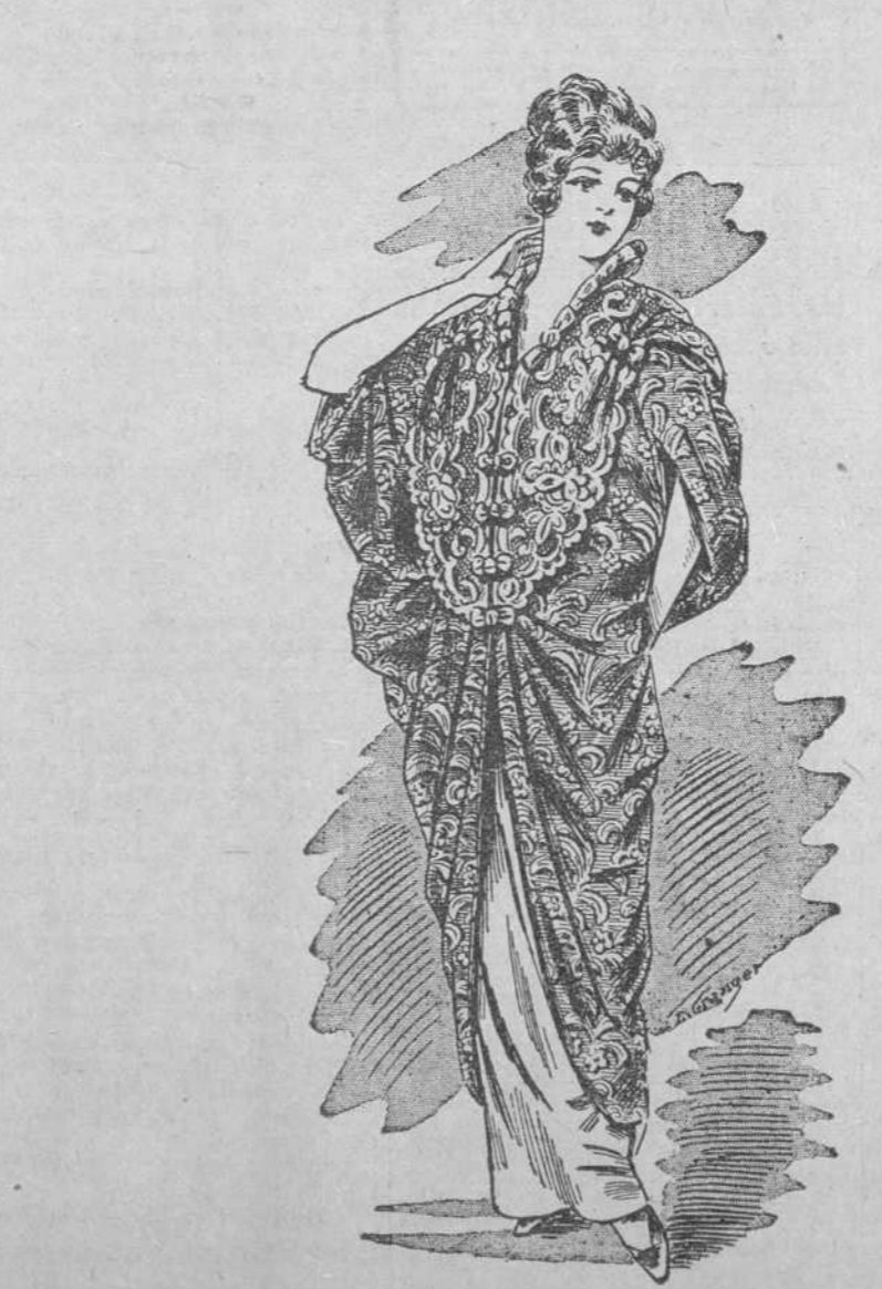
PRIMEROSE Elegante manteau de teatro sobre velo negro, forrado de seda, última novedad.