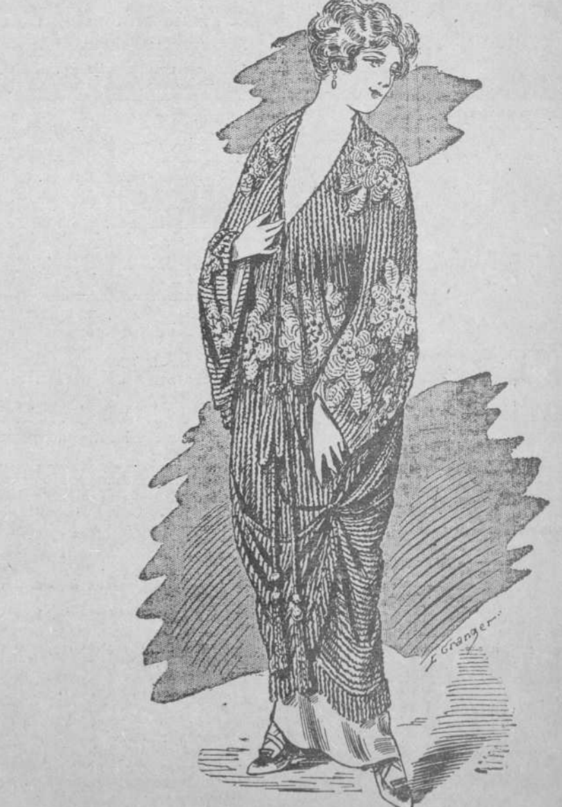
Elegante salida de teatro en tejido lamé, cuello encaje oro, forrado seda.