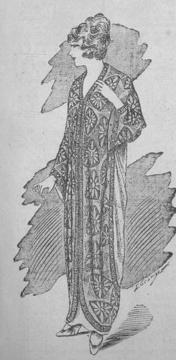
LEOPARD Salida de teatro en tul negro plateado, forrado crespón de china. Artículo de novedad.

La próxima temporada de ópera del gran Teatro del Politeama, dá a las damas elegantes de esta capital una gran oportunidad para adquirir las selectas capas, abrigos y salidas de teatro, de las cuales ofrecemos aquí algunos modelos. Para la actual temporada invernal es preciso acudir por sus trajes a "LA FILOSOFIA" la más selecta colección de telas, abrigos, trajes hechos de calle, de paseo, de gran soiree, en soberbia exposición están a la venta en "LA FILOSOFIA" señalada esta casa como la soberana de la elegancia femenina.