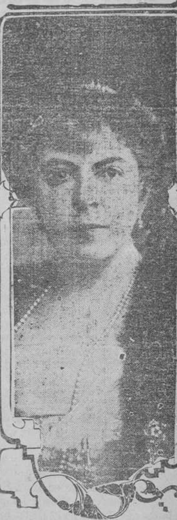
UNA PRINCESA EN APuros. — La princesa Lwoff Parlaghy, conocida en el mundo entero por su habilidad como pintora, por su elegancia exquisita y su lujo, acaba de sufrir un gravísimo contratiempo en su fortuna, con motivo de la guerra europea, que tiene la ventaja de que afecta por igual a los ricos y a los pobres. La princesa, cuyo retrato publicamos, ha tenido que abandonar las lujosas habitaciones que ocupaba en el soberbio hotel Plaza, de New York, y las cuales había convertido en un verdadero museo de arte, para ir a refugiarse en casa de una amiga que le ha brindado hospitalidad, Madame Parlaghy, que en tiempos normales goza de una renta de ochenta mil pesos, ha quedado a deber en el Plaza la friolera de 12,000 dólares.

El Gobierno se propone presentar al Parlamento importantes proyectos y tiene el propósito de hacer que a la mayor brevedad posible sean aprobados los que ahora quedaron pendientes.