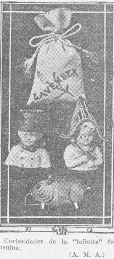
Curiosidades de la "toilette" femenina. (A. M. A.)