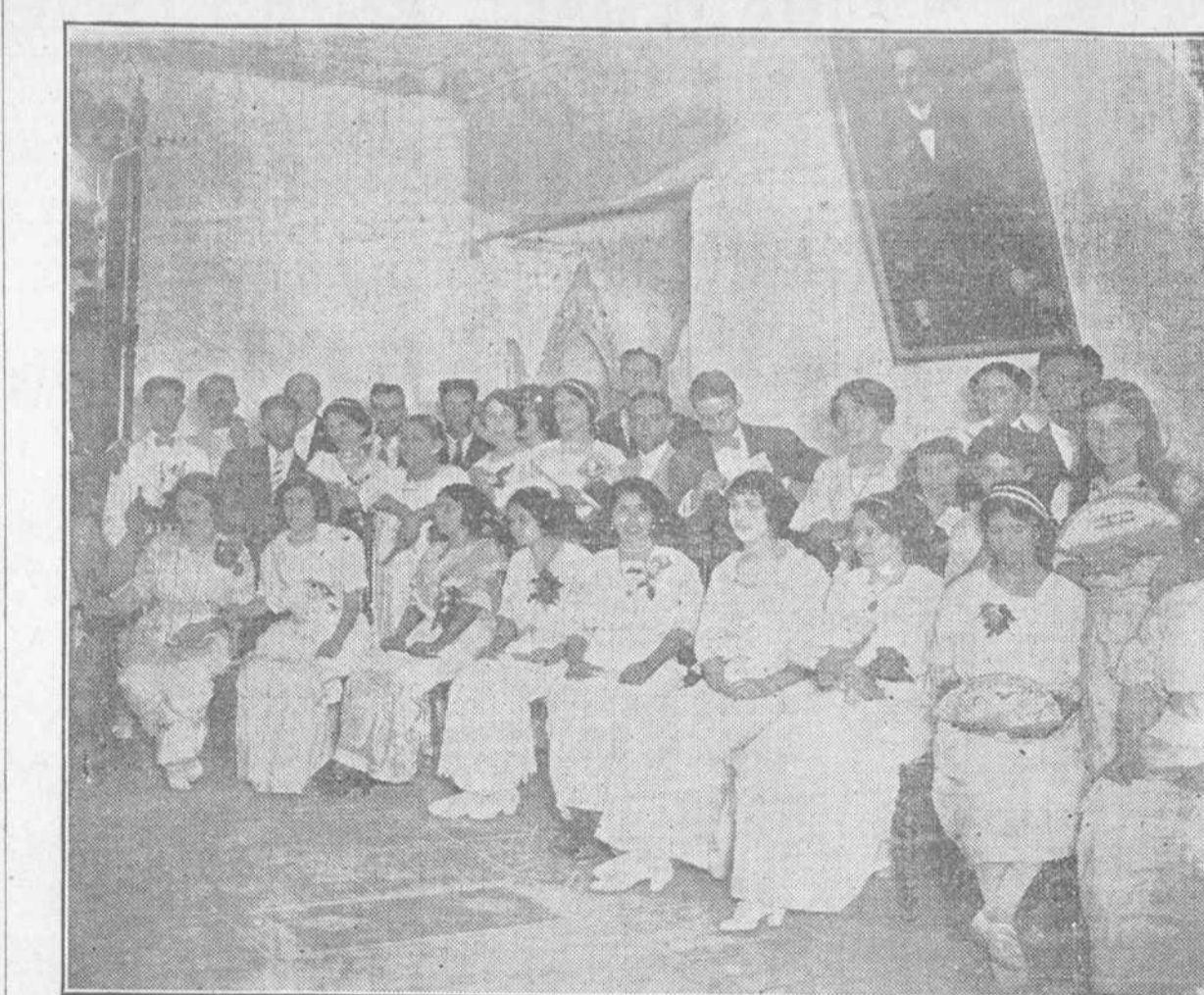
Grupo de concurrentes al baile celebrado en el club Martí.