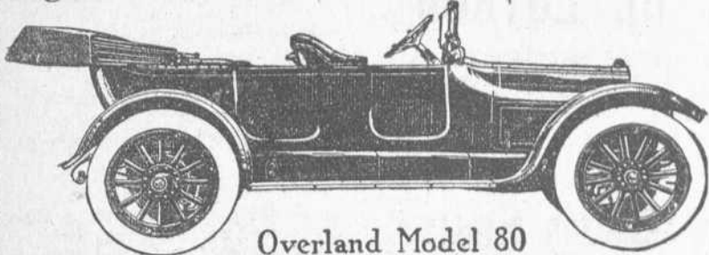
Overland Model 80