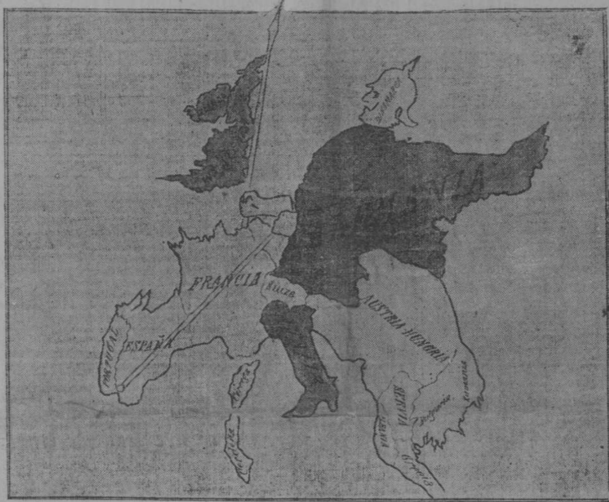
LA EUROPA ARMADA. (FANTASIA BELICO-GEOGRAFICA).