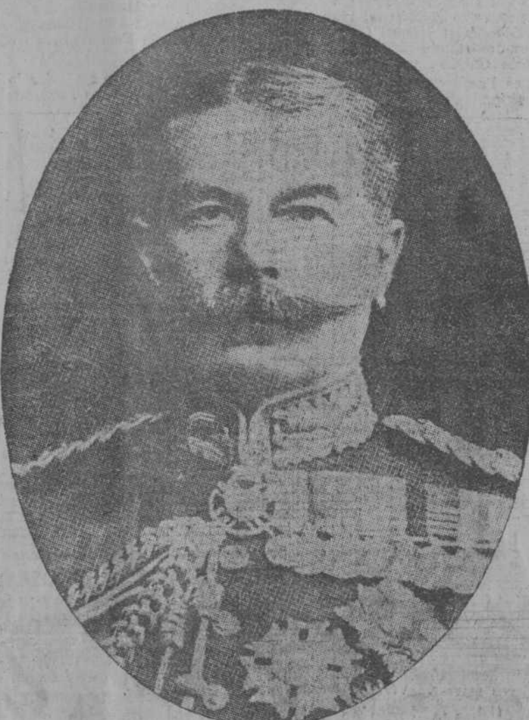
Lord Kitchener, Capitán General del Ejército inglés.

Los alemanes vuelven a bombardear los fuertes de Lieja. Filas alemanas perecieron en las trincheras eléctricas de esta heroica ciudad belga.