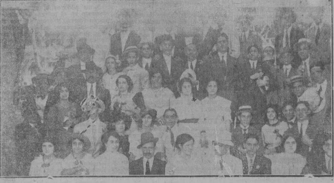
GRUPO DE CONCURRENTES A LA MATINEE DEL CLUB TINETEN SE EN LA MAMBISA.