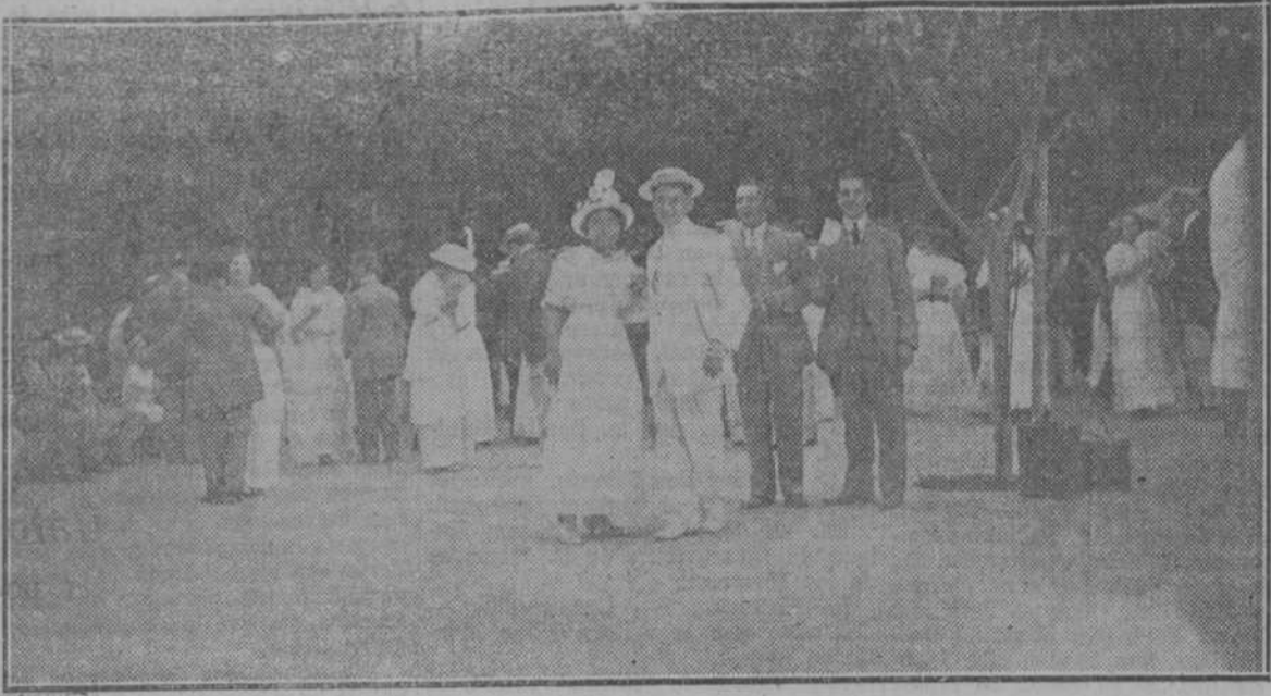
INSTANTANEA TOMADA DURANTE EL BAILE EN LA JIRA DE LA LATINO.

Penetramos en Palatino Park. Y los jóvenes amantes que formaban la brillante comisión de fiestas nos recibieron muy efusivamente. ¡Gracias, rapaces! Y en Palatino Park todo era júbilo; cantaba el orquestrón; gemía una dulce alborada la gaita; una linda "mufleira" entonaba la brillante banda de música de Monterroso; la orquesta, la banda y doliente orquesta, competía con la banda suspirando un romántico danzón. Bailaban las parejas; los romeros y las romeras subían por centenares; la alegría gallega inundaba los corazones. Y Galicia la noble, la culta, la heroica, la humilde y la risueña, cantaba todo su ardoroso entusiasmo. Y todo esto que era alma de nuestra alma, alma de nuestros amores, alegría intensa y fortificante de nuestras almas, que llovía la nostalgia del lindo rincón, lo presidía un estandarte rojo y dorado, que decía: Taboada, Chantada y Puerto Marín, sociedad gallega de instrucción, sociedad de altruismo incomparable.