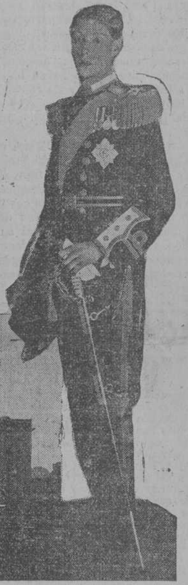
El Rey Jorge V, de Inglaterra.—El Príncipe de Gales, Eduardo Alberto.—El arsenal de Portsmouth.—El Real Palacio de Buckingham.