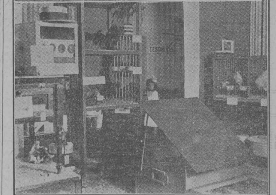
GRUPO DE MIEMBROS DE LA ASOCIACION CUBANA DE AVICULTURA.

Avicultura al dedicarse con empeño en obra que tan perseverantemente han emprendido de dos años acá.