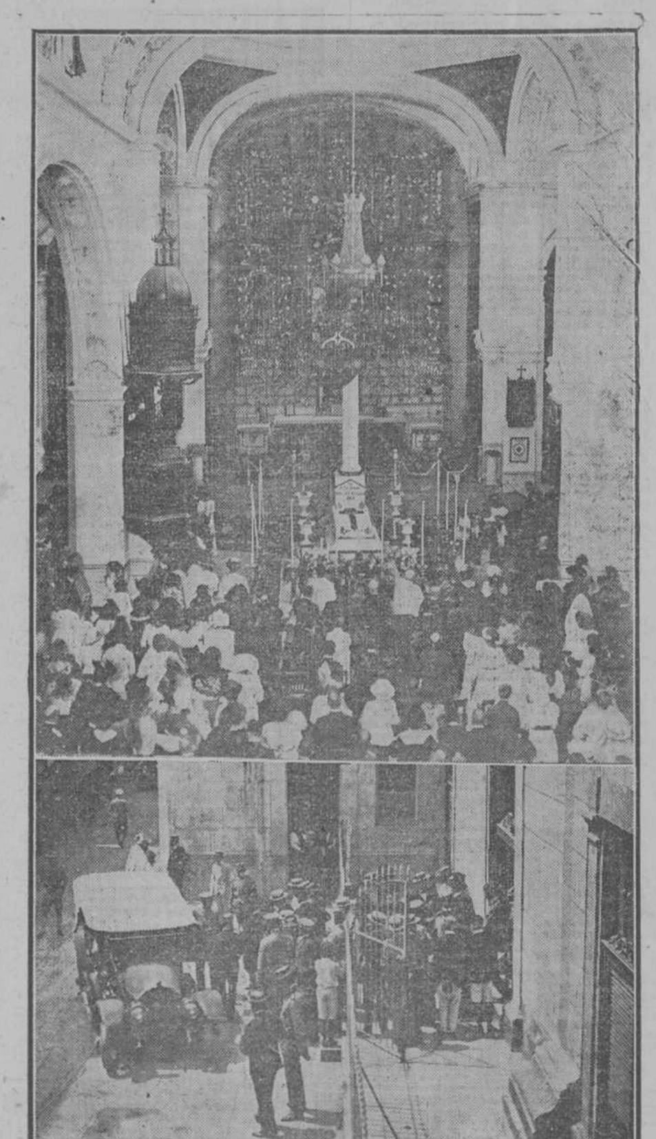
ASPECTO DE LA IGLESIA DE SAN FELIPE DURANTE LA CELEBRACION DE LAS HONRAS FUNEBRES POR EL ALMA DEL GENERAL ARMANDO DE J. RIVA...

OBSEQUIO A la entrega o envío de este anuncio, acompañado de 20 centavos plata española, le será entregada o remitida, una magnífica caja de 100 plumas, sistema J. B. Mallat, números 10 o 12, a elegir, en la librería de A. de Lorenzo, Neptuno 11, Habana. Interior: sellos o moneda