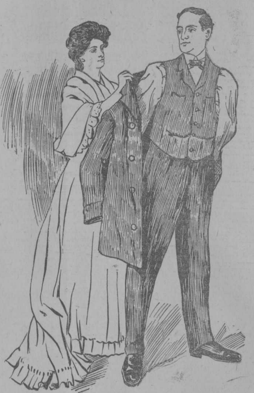
Ven temprano y no te olvides de pasar antes por