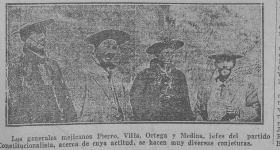
Los generales mejicanos Fierro, Villa, Ortega y Medina, jefes del partido Constitucionalista, acerca de cuya actitud, se hacen muy diversas conjeturas.

Por la policía municipal de Bayamo fue capturado en la mañana de hoy el prófugo Francisco Hechavarría, el cual ingresó inmediatamente en la Cárcel.