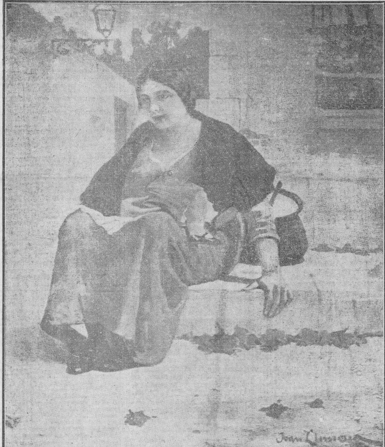
"La esposa del obrero", cuadro de Juan Llimona.

Este extraño fenómeno se atribuye a algún efecto de las ondas hertzianas todavía desconocido.