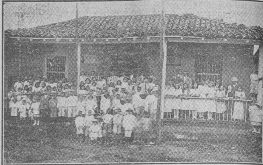
SONGO.—Los alumnos y profesores de la Academia "Crombet" y alumnos concurrentes a la fiesta celebrada el 20 de mayo último.