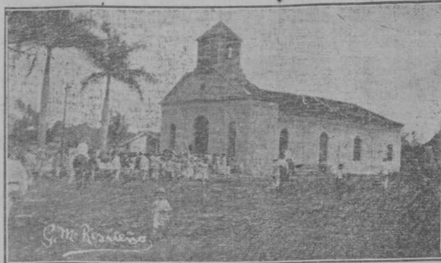
LLEGADA DE MONSEÑOR COURRIER A LA IGLESIA DEL PERICO

No creemos esta medida de las más prudentes, puesto que en esta forma, la compañía será la más perjudicada y al público en vez de trabas y cortapisas hay que facilitarle toda clase de comodidades, puesto que es el que religiosamente paga los enormes precios que le obligan a pagar.