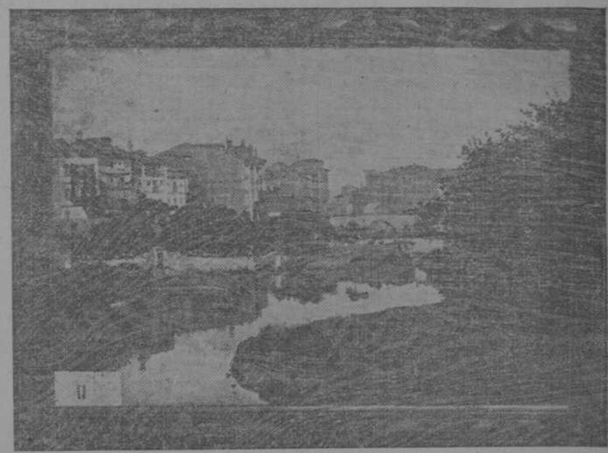
PAISAJE ASTURIANO, CUADRO DE MARTINEZ ABADES.

Puente de Isabel II, Bilbao.—En la ría de Bilbao.—Un jardín de Zaauz, Guipúzcoa.—San Pelayo, Zarauz, Guipúzcoa.—Paisaje del Cadagua, Bilbao.—Del río de la Guía, Gijón.—Paisaje de Villaro, Bilbao.—Del alto de Oseja, Castilla.—Crepúsculo, Bilbao.—Entrada del pueblo, Zarauz.—(Corresponden al 75 y 76) Estudios de Jardín. Paneau.—Un rincón del Retiro, Madrid. De Aurora Ma. Abades.—Ángelita, cabeza de estudio.—Virgen María.— Enamorada.— ¡Éxtasis!—Oración.— Flores.— Drama en la calma.—Entre dos luces, Zarauz.—Entre peñas, Ribadesella.— Del alto de Ardines.—San Antón, Llanes.—Playa de San Lorenzo, Gijón.—Atardecer en Las Palmas, Canarias.—De la ría de Bilbao, Deusto.—Un rincón de Pasajes, Guipúzcoa.— Efecto de luna en Zarauz.—Preparando los palenques, Gijón.—Entre dos luces, puerto.—Baja de mar.—Playa de la Cautera, Las Palmas, Canarias.—Punta del Lucero, Bilbao.—De la Isleta, Las Palmas.— ¡Abandonado! — Barges a la carga, Bilbao.— Corresponde al anotado 33.—Crepúsculo en Bouzas, Vigo.—Ola rompiente.— Océano.— Alto de Somió, Gijón.—Un rincón de Guetaria.—Orillas del Nervión, Bilbao.—Calma.— Oirilla del Isuela.