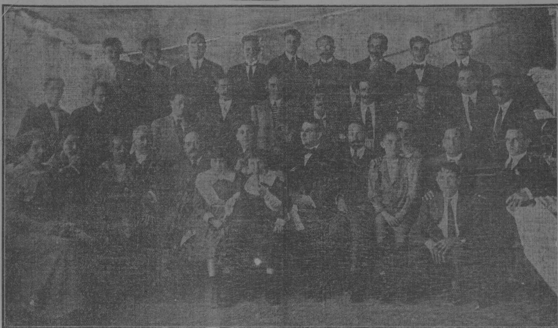
Grupo de asistentes al almuerzo de los reporteros gráficos.

dos días del cocinero imperial. La banda del crucero "Cuba", durante el almuerzo, ejecutó el siguiente programa: 1. Pasodoble "Eva", Lehar. 2. Overture "Zampas", Herold. 3. Polka "Marinera", N. 4. Fantasia "El club de los solteros", Lima. 5. Vals "Cuando el amor renace", Gremmer. 6. Potpourri "Cantos de Cuba", Alvarez. 7. Danzón "El pescado", Ponce. Aquí otra plancha hablaría en elogio del director y de los músicos impresionando los aplausos de los comensales gravemente impresionados. Y hubo los brindis de rigor, en los que se expuso el valor indiscutible de