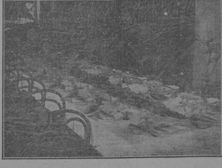
Un aspecto de la mesa