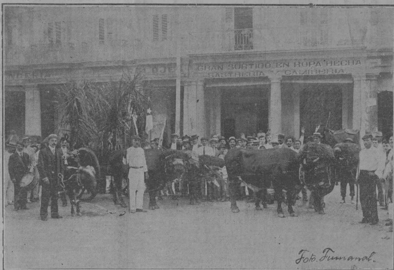
LA FIESTA DE LOS DE VILLAVICIOSA, COLUNGA Y CARAVI A.—Carroza que condujo el tonel de sidra a la Bien Aparecida.