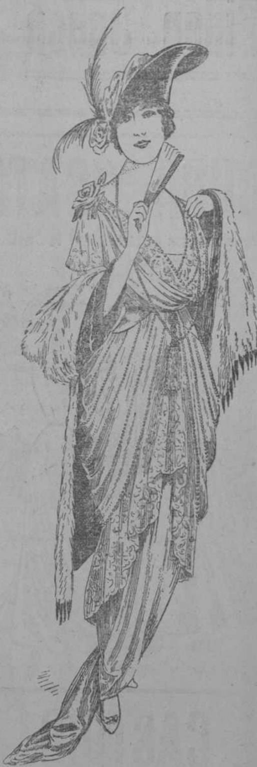
C 4066 alt. 3-24