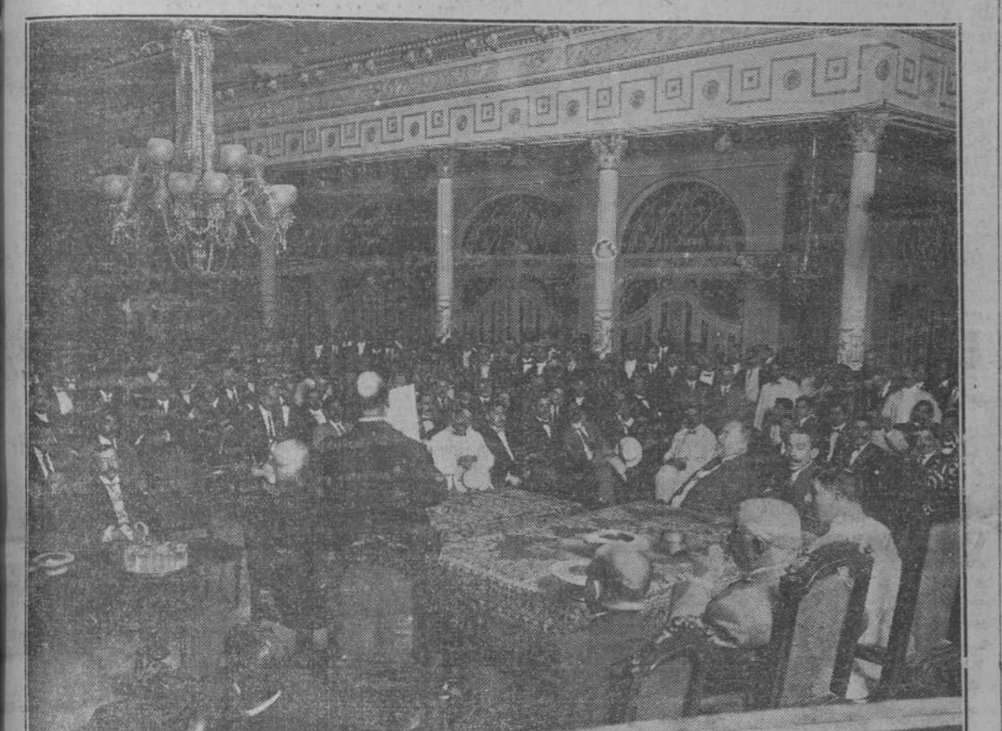
Un aspecto de la Asamblea.

Tercero: Pedir la cooperación de la Cámara de Comercio, de la Lonja de Viveres y de los comerciantes que simpatizan con la idea y reconozcan los perjuicios que a nuestros merca-