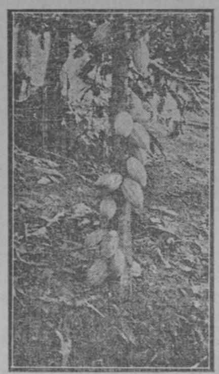
LA RIQUEZA DEL CACAO.—Tronco de un cacaotero cultivado con esmero.