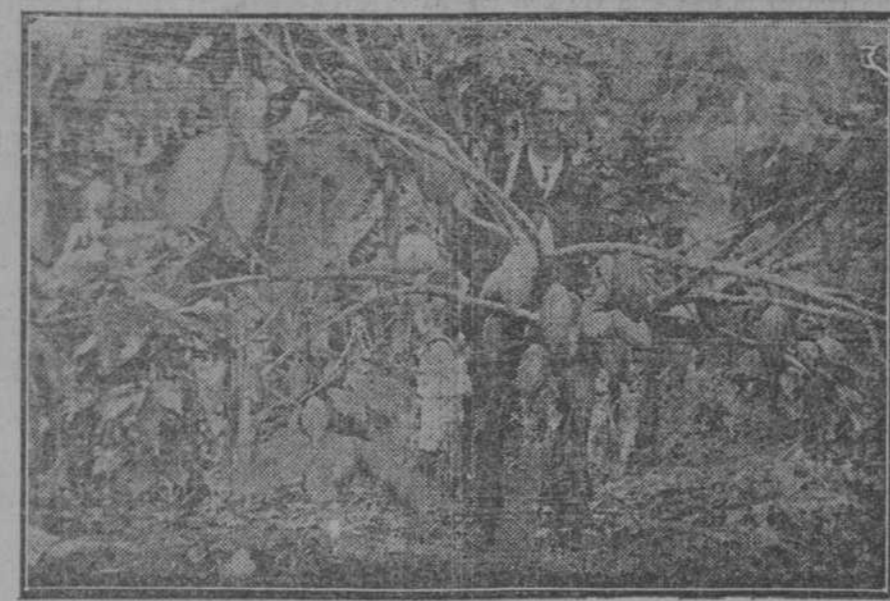
LA RIQUEZA DEL CACAO.—Cacaotero podado de manera que se desarrolle en líneas rectangulares.

A la hora de cerrar esta edición, nueve de la mañana, no hay nuevas noticias de los alzados.