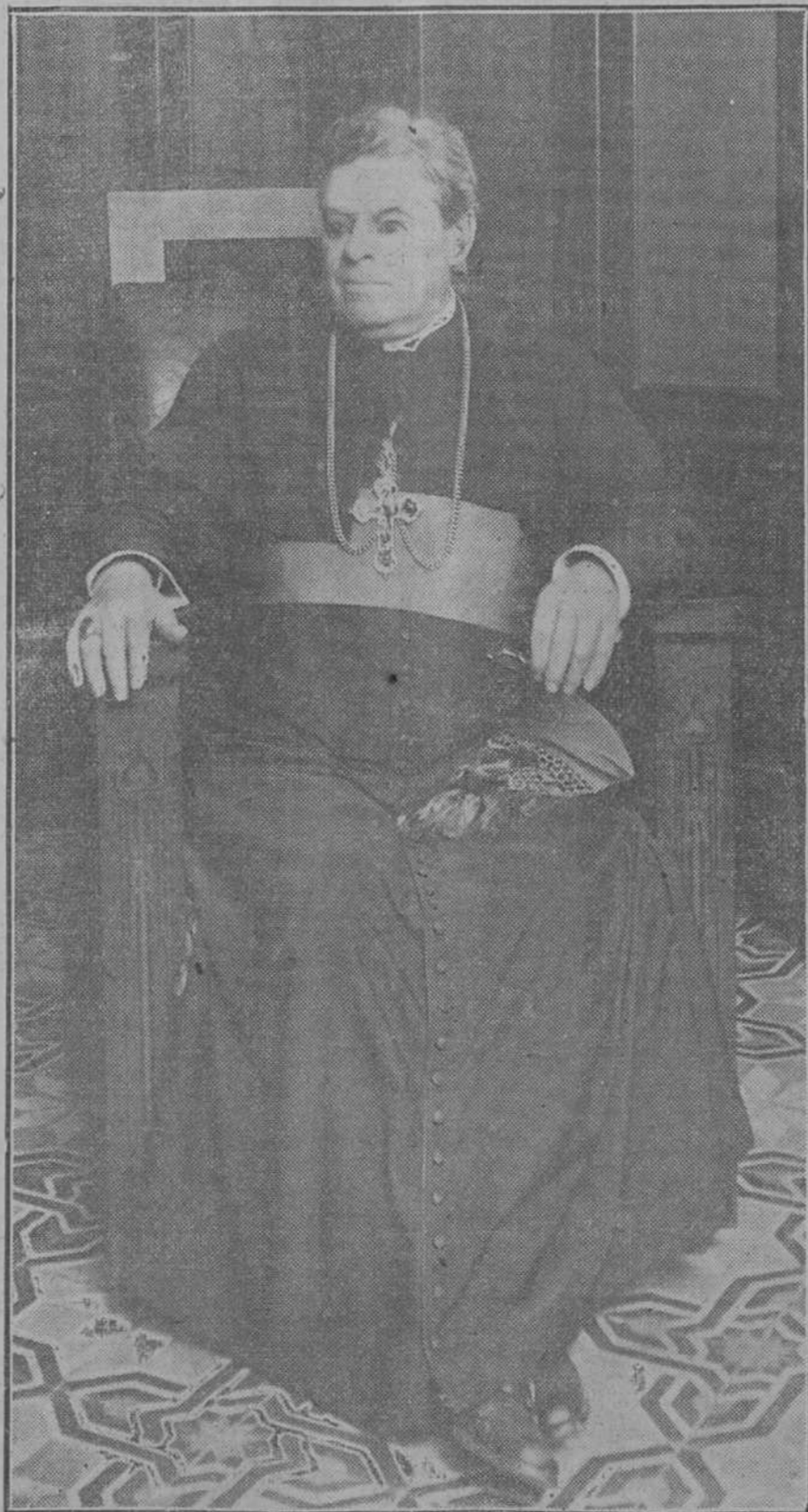
El Ilmo. Sr. Obispo de Matanzas.