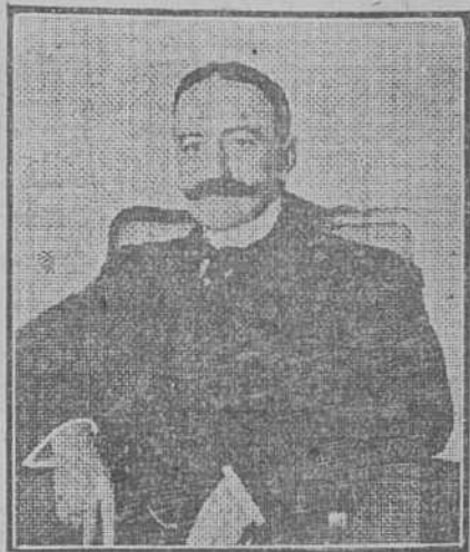
DR. CARLOS MANUEL DE CEPEDAS

Con este acto solemne comienza la hermosa misión que se me ha confiado y que me dispongo a cumplir con verdadero entusiasmo de estrechar cada vez más los lazos de amistad y fraternal solidaridad, felizmente existentes entre nuestros gobiernos y pueblos respectivos, procurando por todos los medios a mi alcance de que esas valiosas relaciones siga, sin interrupción, un creciente intercambio de ideas y proyecciones para bien de nuestros dos países, lo que me será mucho más fácil promover, si para ello cuento con el benévolo apoyo de vuestra excelencia y el concurso de su gobierno, que desde luego pido y espero confiadamente. Yo vengo a decirle, excelentísimo señor, en nombre de mi honorable presidente, que a través de la distancia