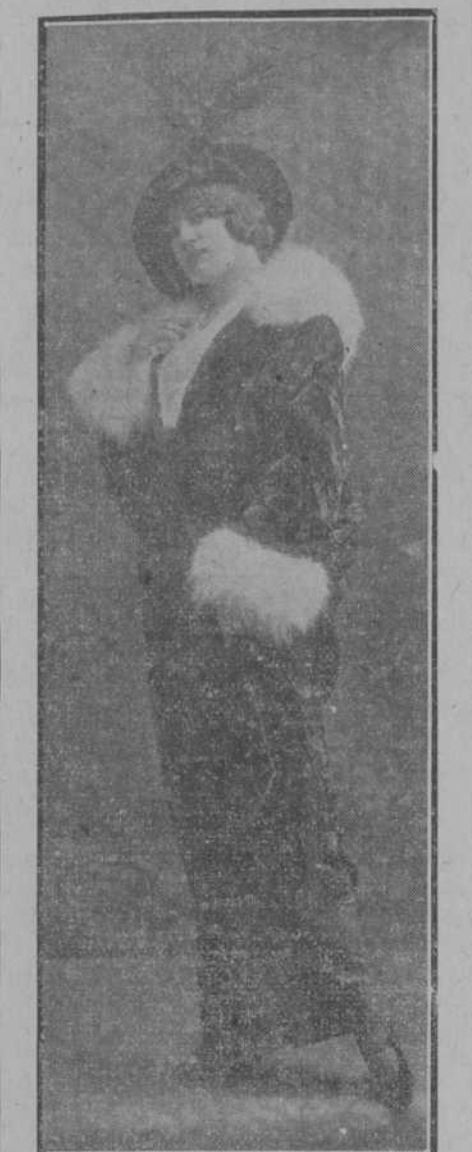
Abrijo de piel de topo guarnecido de piel de zorro blanco.

su negligé si sabe exhibirla con gusto, elegir la forma adecuada y el tinte que armonice con los colores de su rostro.