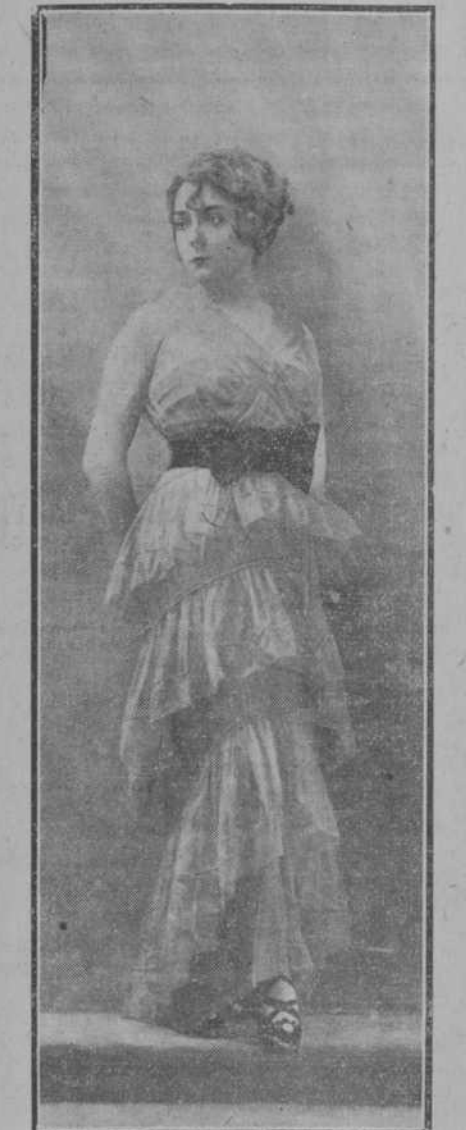
Curioso traje por lo raro, modelo Jenny.