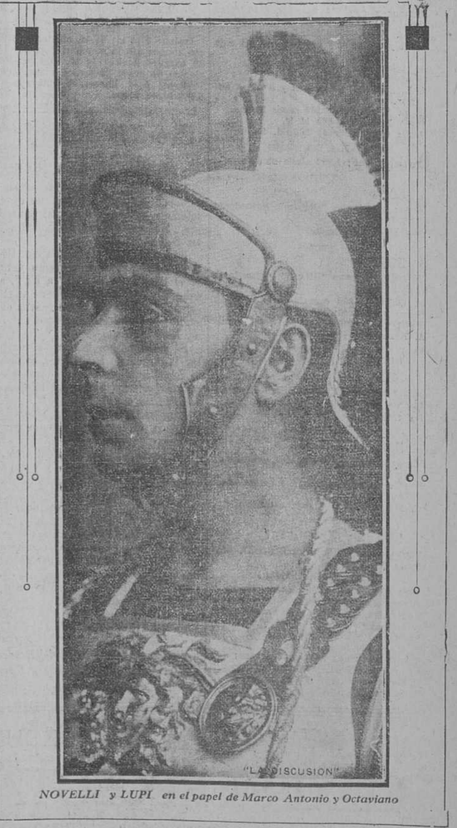
NOVELLI y LUPÍ en el papel de Marco Antonio y Octaviano

Para comodidad del público SANTOS Y ARTIGAS han dispuesto que las taquillas para la venta de localidades estén abiertas desde hoy.—Los dos teatros del Politeama han sido arrendados para poder atender al gran número de personas que desean asistir al estreno de CLEOPATRA .