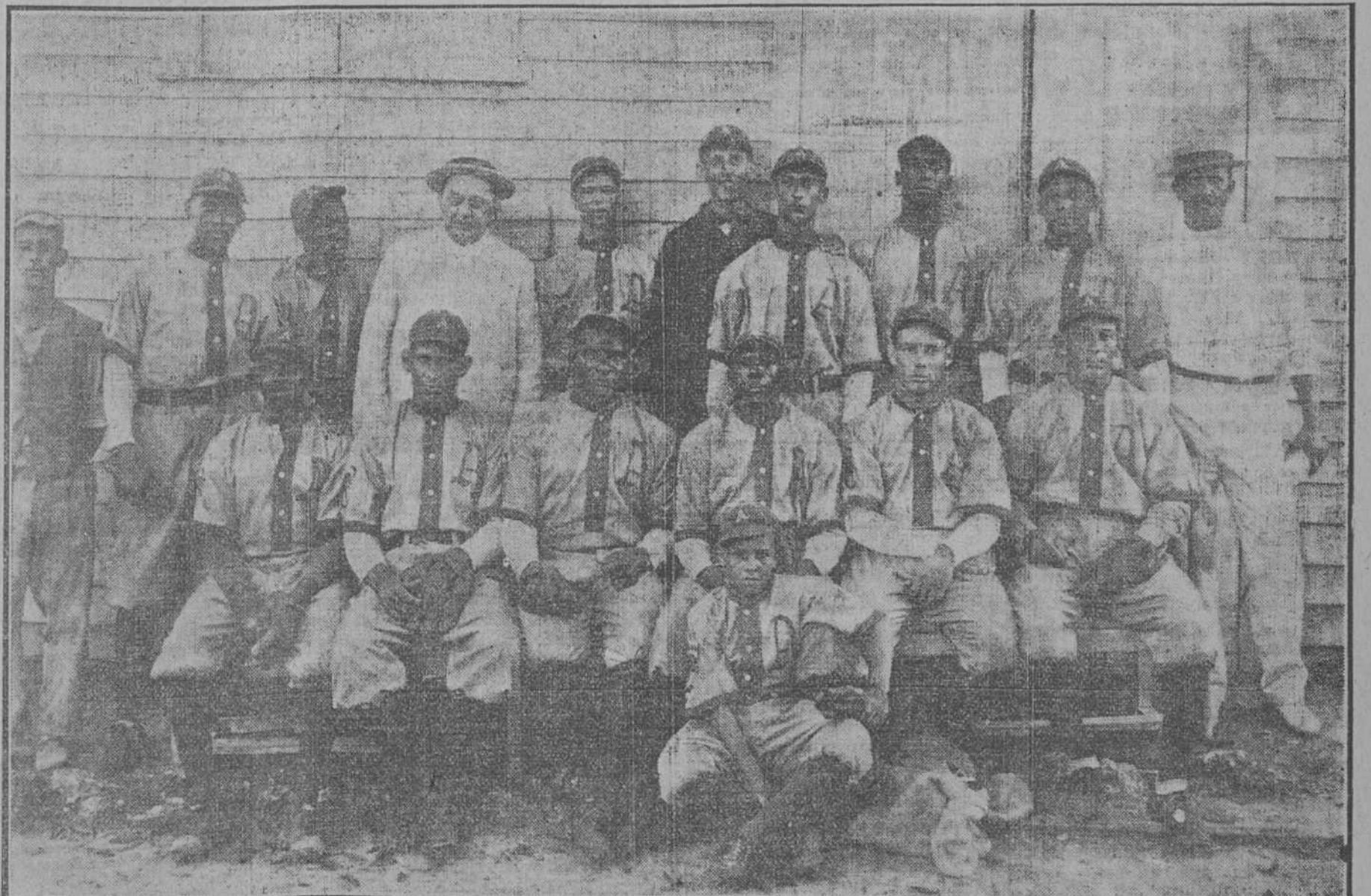
JUGADORES DEL CLUB ALMENDARES