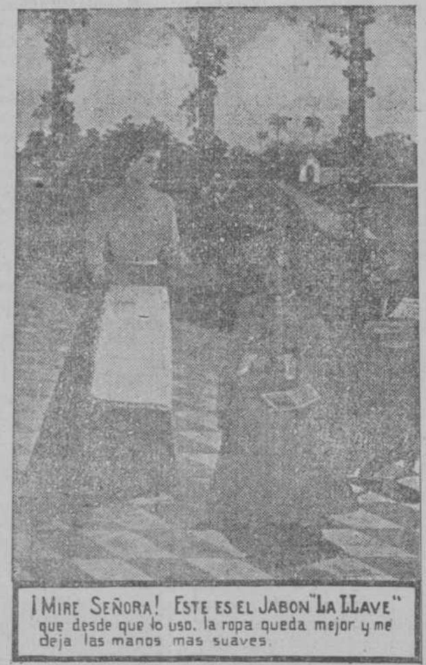
¡MIRE SEÑORA! ESTE ES EL JABON "LA LLAVE" que desde que lo uso, la ropa queda mejor y me deja las manos mas suaves.

Sabatés se distingue por lo bien limpia y aromatizada que queda. ¡Lavanderas! USEN siempre el jabón LA LLAVE Marca que Llevan todas Las barras de Jabón LA LLAVE