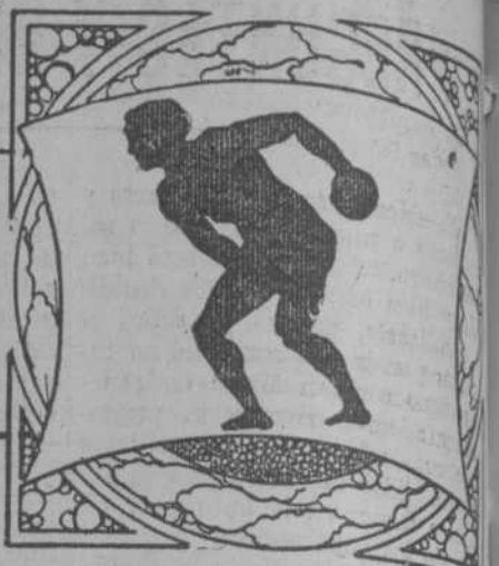
Por Ramón S. de Mendoza