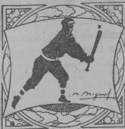
Por M. L. de Linares