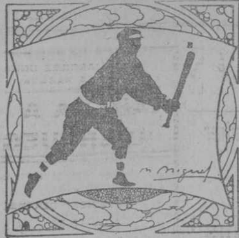
Por M. L. de Linares