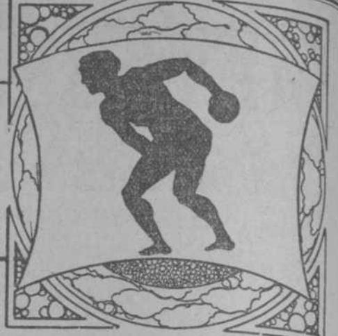
Por Ramón S. de Mendoza