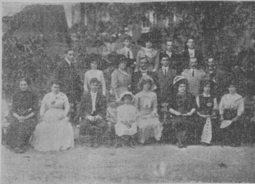
UN GRUPO DE LA FIESTA INAUGURAL DEL CLUB COMPOSTELANO, EN PALATINO

La lluvia era menuda, fría, triste; el campo todo tristeza y soledad; el tren subía lentamente para remontar un pináculo y tras el pináculo hacia alto en una estación humilde y solitaria. Del convoy se había desprendido un enjambre de juventud ruidosa, altaera y audaz; eran los estudiantes que retornaban de sus hogares donde habían pasado las pasadas encantadoras y se dirigían a la santa y sabia ciudad de Santiago de Compostela. Tras la estación se encontraban las monumentales diligencias que debían llevarse los carreteros adelante... Llovía. La lluvia era menuda, fría, triste.