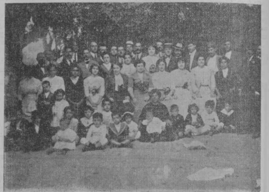
PRIMOROSO GRUPO EN LA JIRA QUE AYER CELEBRO EN "LA TROPICAL" LA SOCIEDAD "VALENCIA Y MURCIA."

Luego susurró la brisa no sé qué chismes de amor; a los chismes contaron las flautas y a las flautas; los violines y a los violines las sonoras guitarras, Valencia y Murcia vivían bajo la sombra bondadosa del árbol abuelo. Y la juventud bailó. Pasaron ellas, las de los cuerpos garridos, las de las bocas de clavel y pasaron ondulando el mandato ardiente y sugestivo del dancón y al pasar nos dijeron que se ha-