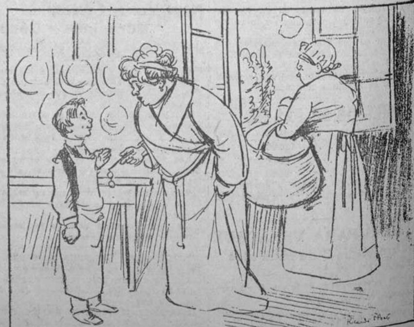
La señora: —Mira, muchacho, si la cocinera se muestra tacaña contigó, avísamelo. El pinche: —No pase cuidado la señora; sé defenderme bien de sus lacras fieras. En cuanto vuelve ella la espalda... le escupo platos.