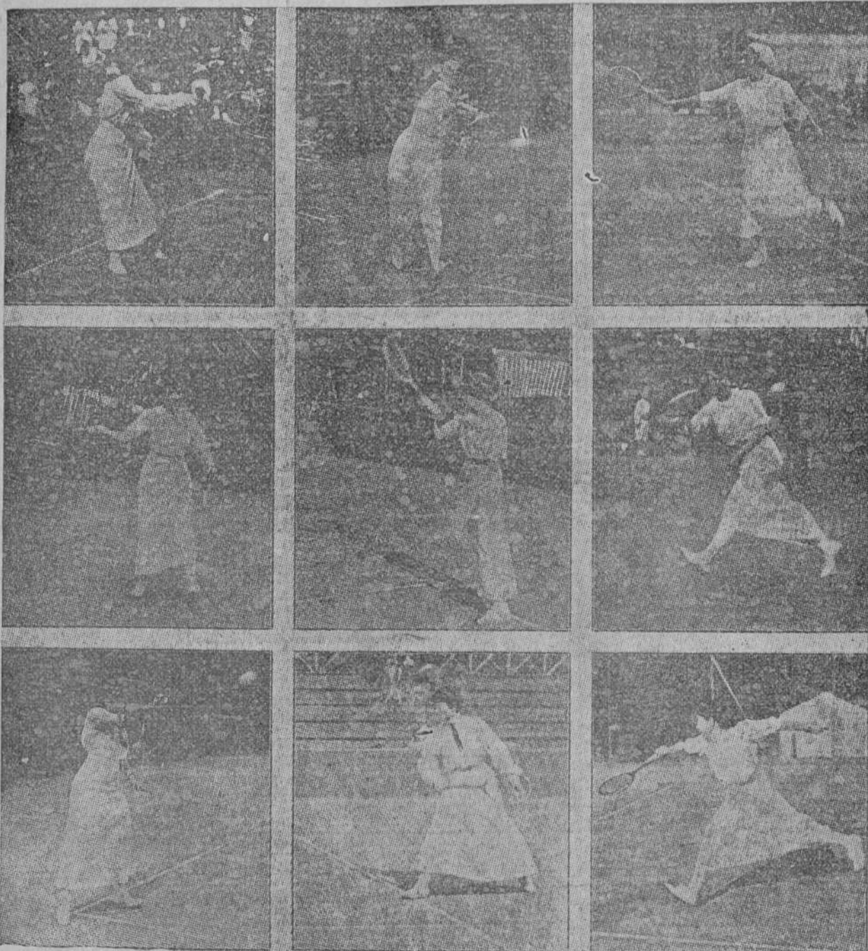
SILUETAS DE JUGADORAS DE "LAWN TENNIS"

El "lawn-tennis" es como algunos lo afirman el más gracioso, el más elegante de los deportes. Las fotografías que reproducimos en esta página que fueron tomadas durante el campeonato internacional organizado por el "Stade français" en su gran "court" del Parque de Saint Cloud aportarán a esa grave cuestión inapreciables testimonios.