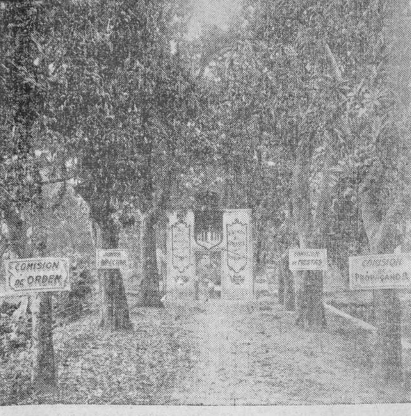
PORTADA DE LA QUINTA DE OBISPO. ROMERIA Y VERBENA DE VIVERO Y SU COMARCA

Hoy también celebran su brillante fiesta los hijos de Vivero y su comarca, cuyo programa ha exaltado el entusiasmo gallego de tal manera que los vivarienses tienen Verbena también.