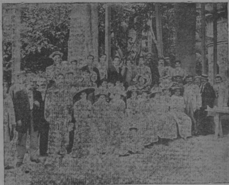
HERMOSO GRUPO DE ASISTENTES A LA JIRA