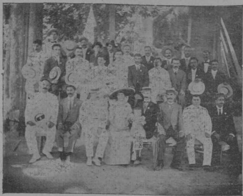
PRESIDENTE Y DIRECTIVA DE LA UNION ORENSANA

La azotea del Politeama refulgía en su artística iluminación; de aquellas alturas se elevaba grato rumor de al-