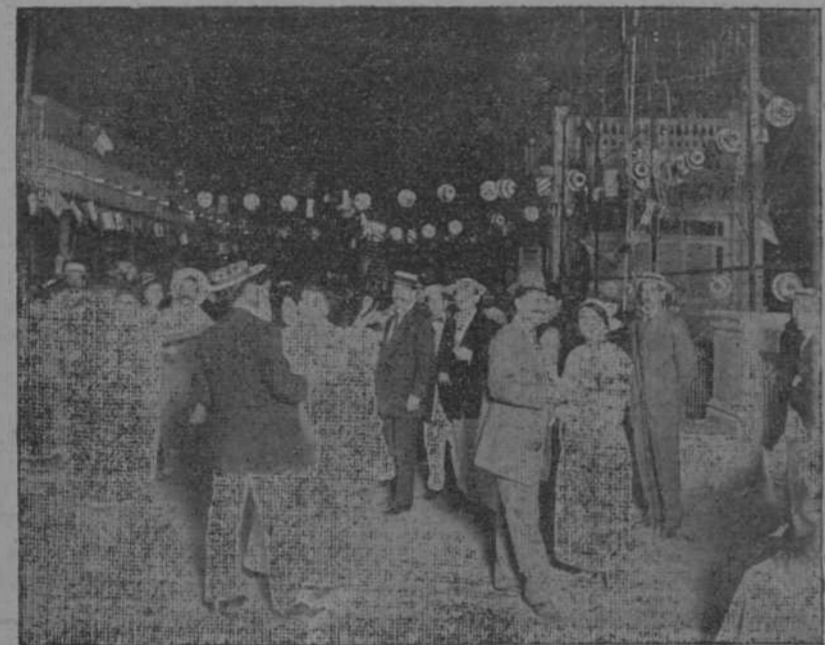
DISPONIENDOSE A BAILAR EN LA VERBENA